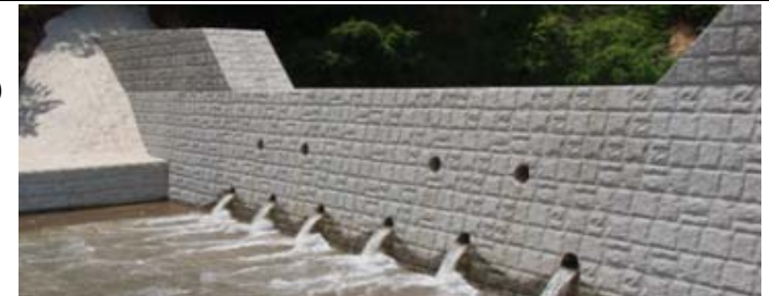
コンクリート谷止工