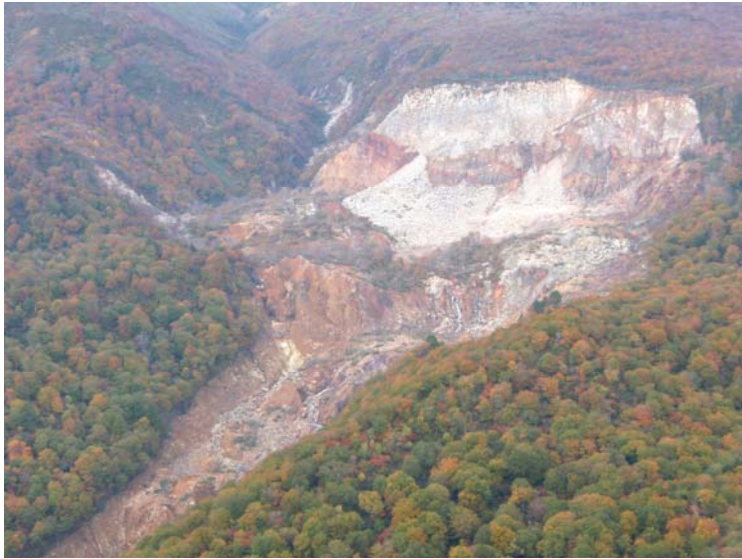
産女川上流部の荒廃状況 (平成21年10月13日)

震災によって荒廃した溪流において溪床を安定させ溪岸浸食を防ぐ谷止工などにより、復旧対策を進めています。