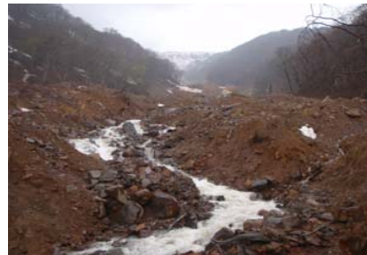
産女川ダム工施工箇所