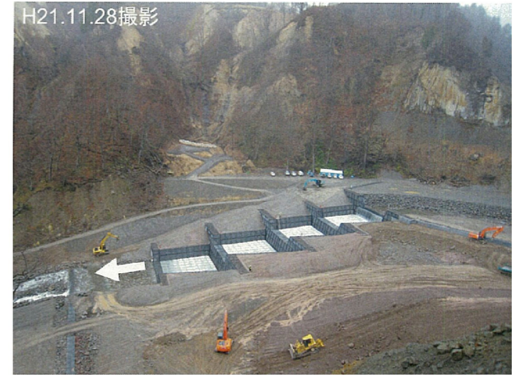
急勾配区間の復旧例（湯浜地区）