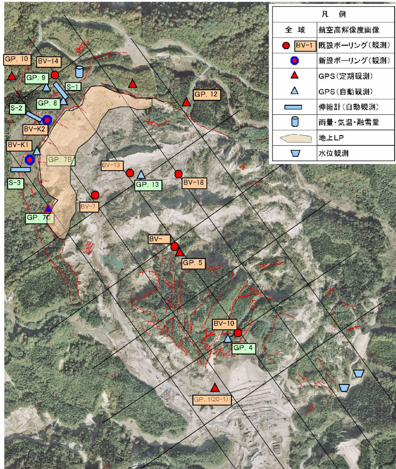
図 5.2.1 地すべり・崩壊対応に関するモニタリング計画図