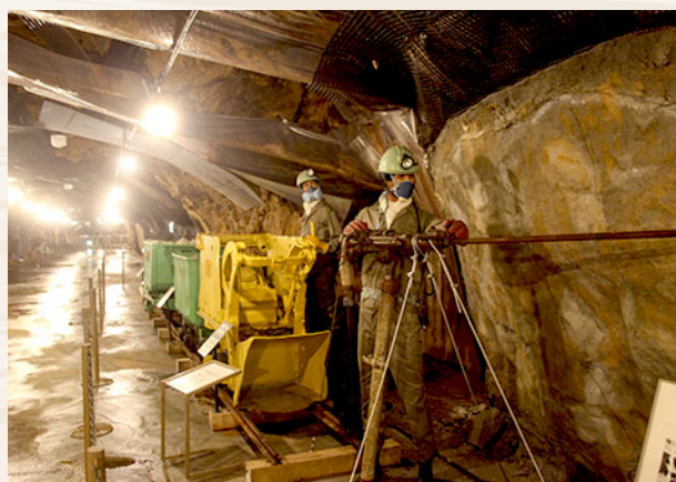
細倉マインパーク

◎「細倉マインパーク」は平成28年7月にリニューアルした観光坑道テーマパークです。約1,200年前に発見された細倉鉱山は、鉛や亜鉛、金、銀も産出されました。1987年に閉山してからは細倉マインパークとして、多くの観光客に鉱山のことを知ってもらう人気のスポットとなっています。