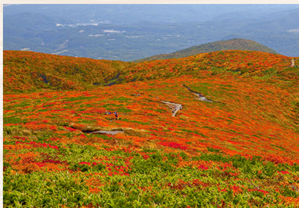
紅葉に染まる栗駒山

栗原市は宮城県の内陸北部に位置し、面積の8割近くが森林や原野、田畑で占められた岩手・秋田両県に隣接する自然豊かな田園観光都市です。面積は800平方キロメートルを超え、県内最大を誇ります。また、市内北部には標高1,626メートルの栗駒山がそびえ、東西に迫三川が貫通し大地を潤しています。