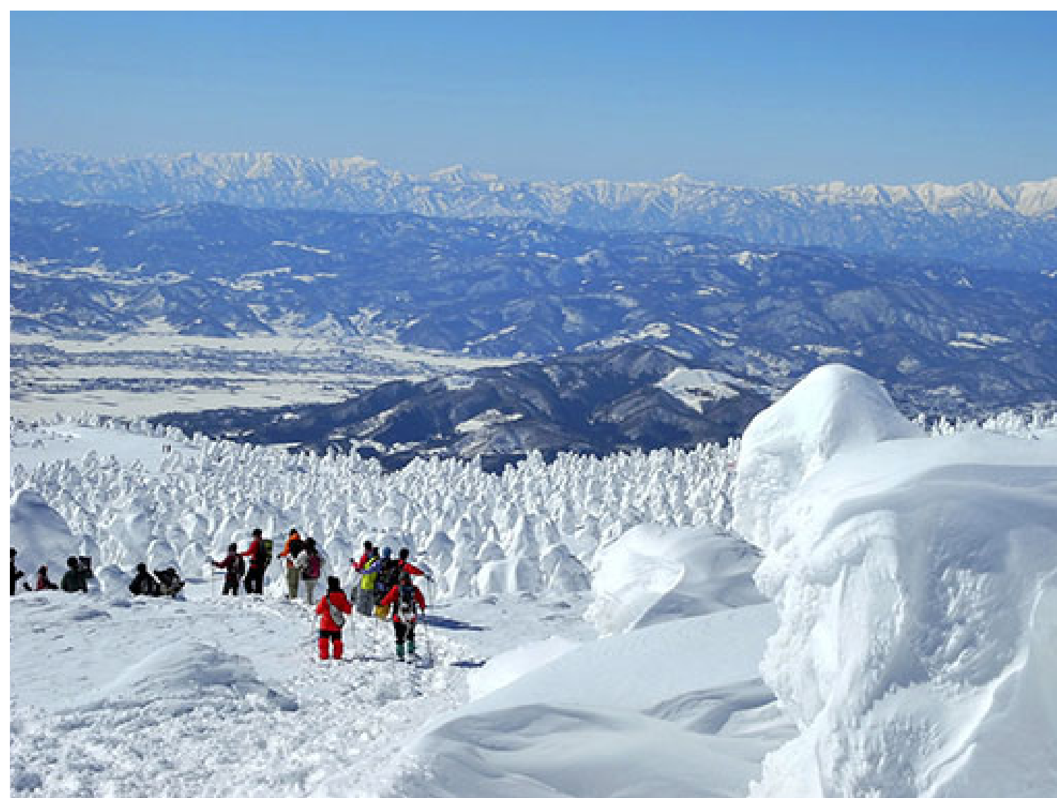
樹氷ウォーキングの景観は絶景

上山市は、山形県都山形市の南隣に位置し、火口湖「お釜」や樹氷で有名な蔵王連峰や里山に囲まれた盆地です。農業が盛んで、果樹はサクランボに、ブドウ、ラフランス、干し柿と多種多様です。近年は、このブドウを使ったワイナリーの進出も目立っています。また、開湯560年を超える温泉地を備えた城下町でもあり、市内中心部を羽州街道が走る、温泉町、城下町、宿場町と3つの顔を持つ全国的にも珍しいまちです。