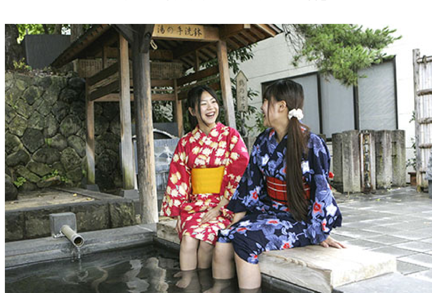
温泉街には5か所の足湯。浴衣で散策もオススメ