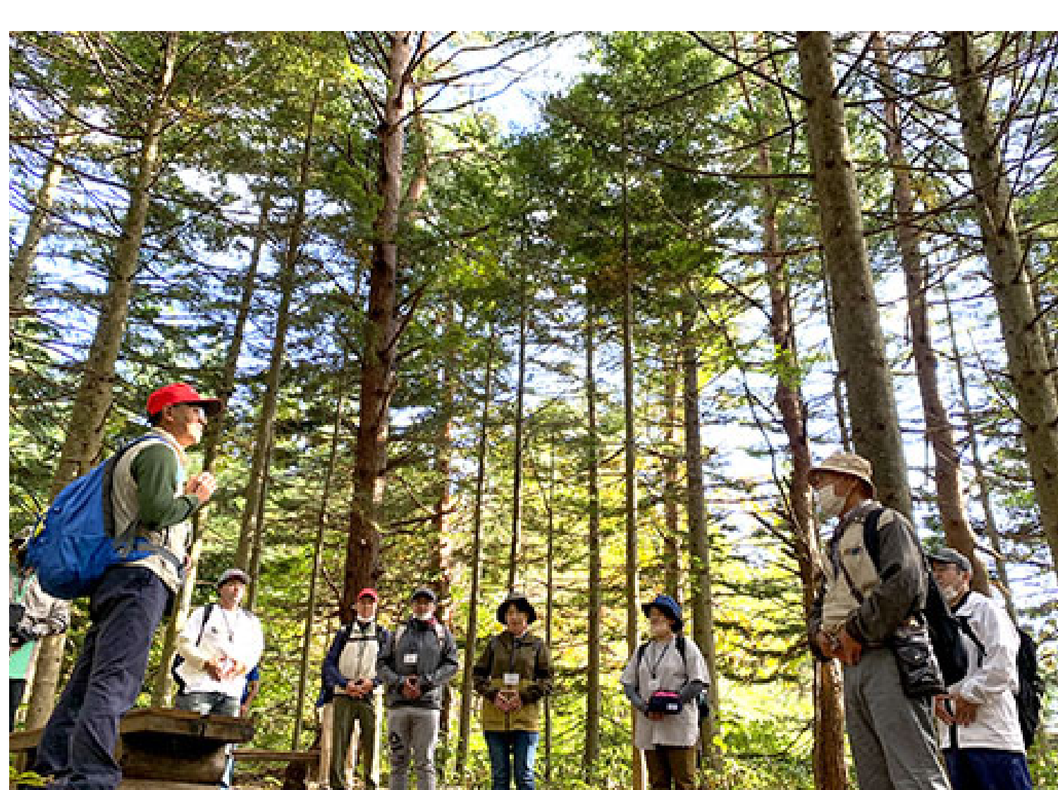
蔵王坊平人気コース「癒しの森」