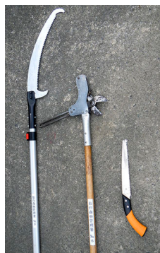
使用した用具（左から 高枝切鋸、枝打ち鋸、手鋸）

現地は、仙台市青葉区上愛子（かみあやし）字箱倉山（はこくらやま）国有林52林班に3小班的のヒノキ人工林26年生の箇所となっています。当日は、秋晴れに恵まれ、