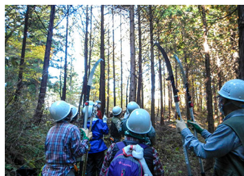
現地での実演指導