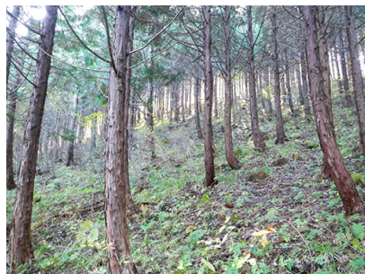
作業後の林内の様子

国有林では現在あまり行われていない枝打ち作業ですが、参加者の方々が森林の育成させるうえでこの保育作業の一つの工程として森林づくりの流れを理解していただきました。それを各々がそれぞれの地域での活動や森林環境保全活動に役立てていただき、各地域に美しい森林が増えていくことを願います。