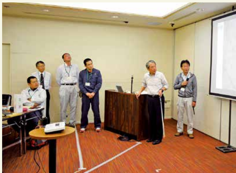
H29 実践研修プレゼンの様子