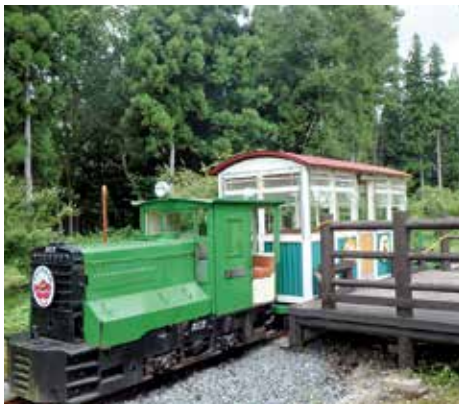
現在は観光客を乗せている安楽城森林鉄道のディーゼル機関車（まむろ川温泉 梅里苑）

4月から初めて森林事務所での勤務となり、先輩方に支えられながら手探りで業務に当たっております。今回は、管内の特色や業務で感じたことなどをご紹介いたします。 私が勤務している大沢森林事務所は、山形県真室川町の西部、最上川水系鮭川の上流域に位置し、約1万2千haの国有林を管轄しています。真室川音頭は知っているという方もいるかもしれませんが、真室川町は古くから林業が盛んな町です。江戸時代には京都の東本願寺をはじめ大寺院の建築や改修の際にケヤキなどの巨木を産出してきました。また、昭和になると町を東西南北に広がる安楽城森林鉄道により多くの丸太を産出しました。現在は主にスギの人工林が広がっており、今でも木材を供給する役割が大きく求められています。