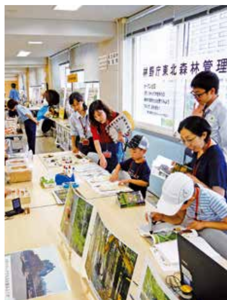
この鳥の鳴き声聞いたことがある

財務局、植物防疫所塩釜支所及び動物検疫所北海道・東北支所仙台空港出張所の参加機関がそれぞれの特徴をいかした企画で参加しました。