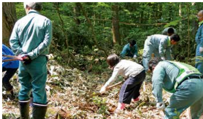
慣れないクワの扱いに奮闘