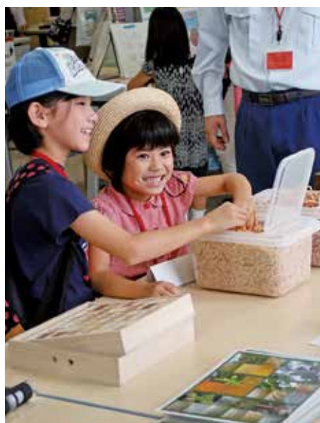
こっこの木の香りはどうかな

当日は、台風が接近中という予報も出され、人の出足が鈍いのではと予想していましたが、開催時間の10時スタートとともに会場には約140名の子どもの連れの家族が訪れました。東北森林管理局のブースの中では「木のおいやを感じてみよう」「木の重さを量ってみよう」のコーナーが特に人気が高く、「木のおいやを感じてみよう」のコーナーでは、子どもたちにはスギのにおい、大人にはヒバのにおいが好評でした。