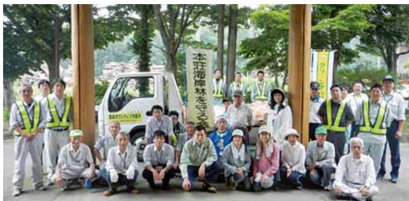
作業終了後の記念撮影