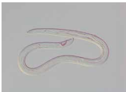
図1. マツノザイセンチュウ雄成虫 (体長約 1 mm)

マツ材線虫病、いわゆるマツ枯れが日本において広がるのは、病原体マツノザイセンチュウ ( Bursaphelenchus xylophilus ) (図1) を媒介者であるマツノマダラカミキリの成虫が枯れたマツから健全なマツへと運ぶからです。マツノザイセンチュウが属する Bursaphelenchus 属は、次々と新種が見付かっており、現在世界で約 130 種の線虫からなっています。その中でマツノザイセンチュウのようにカミキリムシに運ばれるものは、実は一部にすぎません。クイムシに運ばれるものが最も多く、ゾウムシに運ばれるものもかなり報告されています。