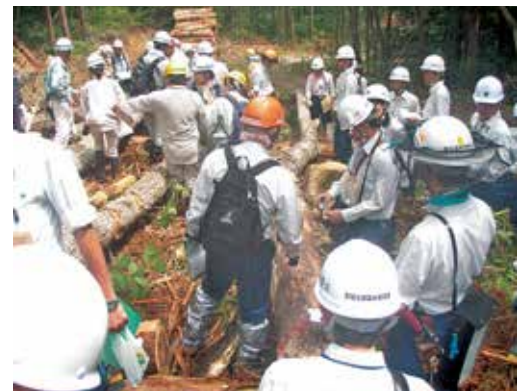
“検討中”の森林管理署チーム

一本として同じ形のない広葉樹から一般材を採材することの「難しさ」を、肌で感じた様子であり、「葉」が無い状態で樹種を判断するのは難しい」との感想が出るなど、近年にない検討会となりました。