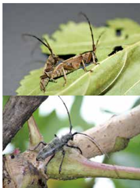
図3. ピロウドカミキリ雌雄成虫 (上)、 センノカミキリ雄成虫 (下)

Bursaphelenchus 属の中でマツノザイセンチュウ及びそれに近縁な線虫の計 14 種は、マツノザイセンチュウ近縁種群に属しており、日本には外来のマツノザイセンチュウに加えて、在来の近縁種 5 種が生息しています。枯れたマツに生息するニセマツノザイセンチュウ ( B. mucronatus ) は、主にカラフトヒゲナガカミキリによって運ばれます。近年、枯れたマツには B. doui 、枯れたモミには B. firmae といった別の近縁種も存在することが明らかになり、媒介者として前者はヒメヒゲナガカミキリやピロウドカミキリ (図3上) が、また後者はヒゲナガカミキリが特定されています。一方、広葉樹にも目を向けてみると、クワイチジクに生息するクワノザイセンチュウ ( B. conicaudatus ) はキボシカミキリに、タラノキに生息するタラノザイセンチュウ ( B. luxuriosae ) はセンノカミキリ (図3下) によって運ばれます。これらのカミキリムシは全て、カミキリムシ科の中のフトカミキリ亜科ヒゲナガカミキリ族というグループに属しており、マツノザイセンチュウ近縁種群との相性の良さがうかがえます。