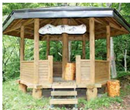
六角堂に設置した丸太の椅子

約2時間の作業を終え、整備前は薄暗く利用しづらい状態であった六角堂が、見通しが良く歩きやすい、利用者の皆様に気軽に休憩して頂ける施設になりました。また、伐倒木はその場で丸太にして皮むきし、六角堂の椅子として利用しました。今後も地域の皆様と協力しながら、眺望山自然休養林がさらに親しみやすい森林となるよう取組みを進めてまいります。