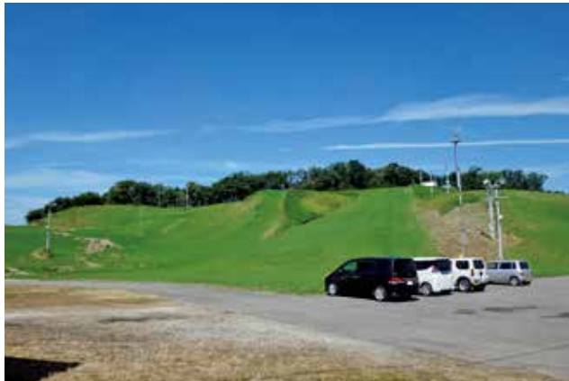
森林事務所から望む秋山スキー場

最近の話題として、8月5日から6日にかけて山形県では、庄内や最上を中心に記録的な大雨となり、住宅や道路など