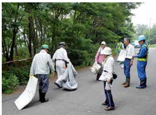
海岸林周辺でのゴミ拾い

今回の活動の結果、まだまだ広い範囲でゴミの散乱が目立つことが分かったため、ゴミの収集やマナー向上の啓発等、活動の継続が必要であると考えています。