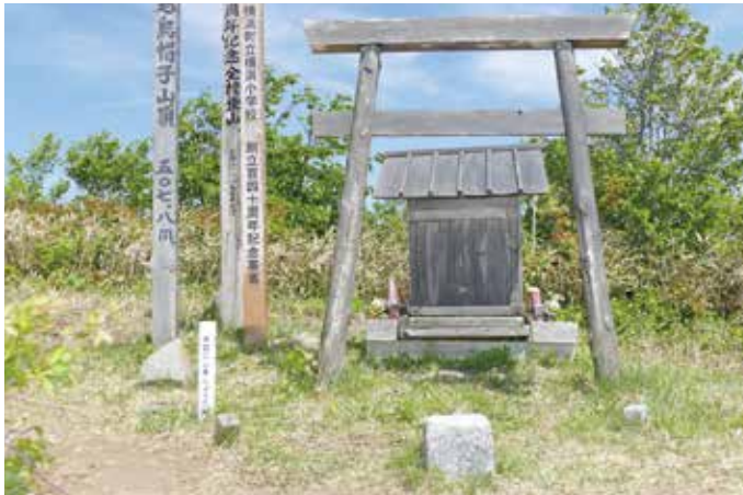
一等三角点（5月中旬撮影）