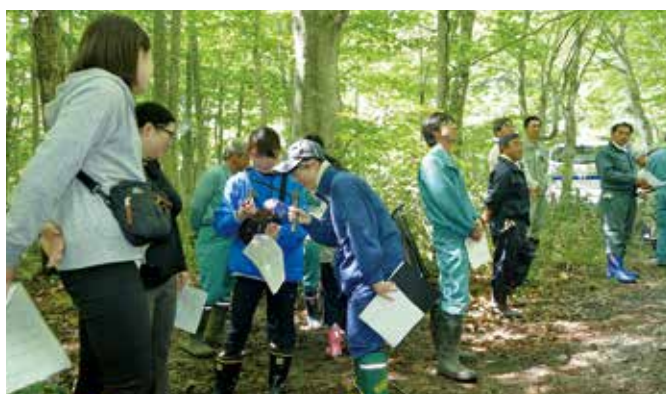
森の中で見つけたものは？（森林教室）