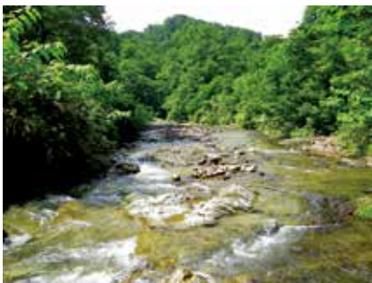
①イワナの生息環境

釣った直後の天然イワナをその場で刺身⑤や塩焼⑥にして舌鼓を打つ! そんな至福の瞬間を、皆さんもしかしたら体験する機会があるかもしれません。その時には、今自分が口に入れるイワナが、一体どれほどの生物をどれだけ食べてここまで成長できたのかに想いを馳せながら、その命を美味しくいただきます。このイワナを育む豊穡の森を後世に残したいと願う気持ちが、きっと芽生えてくるはずです。