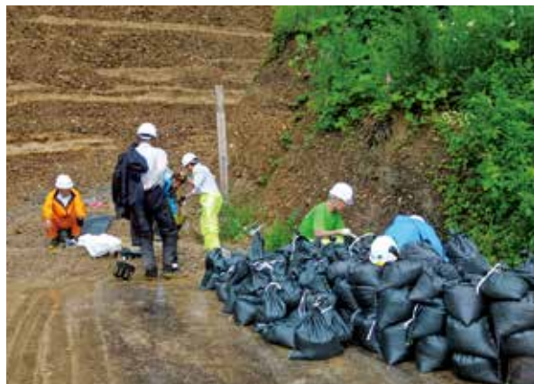
職員協力しての土砂撤去

普段から周りの人に助けってもらってばかりで、まだ一人前にはほど遠いですが、歴代の先輩方が築いて下さった土台を引き継ぎ、国有林が地元の人に必要とされるよう、精一杯業務に取り組んで行きたいと思えます。