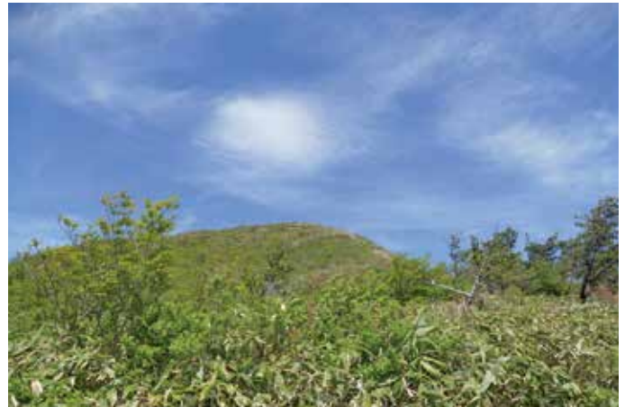
頂上付近（5月中旬撮影）