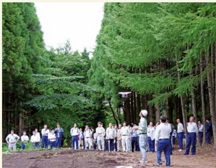
ドローンの実演飛行

木の胸高直径や樹高、本数などを計測しており、多大な労力を要してきました。検討会で実演のあった3D-Walkerは、専門的な知識がなくても背負って歩くだけで、立木の位置や胸高直径を自動計測することができるほか、立木の曲がりも把握することが可能となっております。この機器により多大な労力を要さなくてもある程度の森林情報を得られることが分かりました。