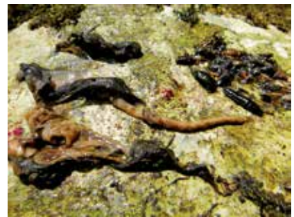
③ネズミ類の尻尾と皮(右上は昆虫類)