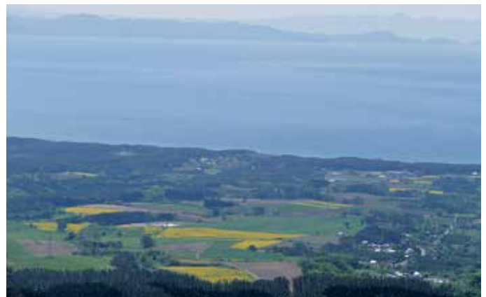
陸奥湾と菜の花（5月中旬撮影）