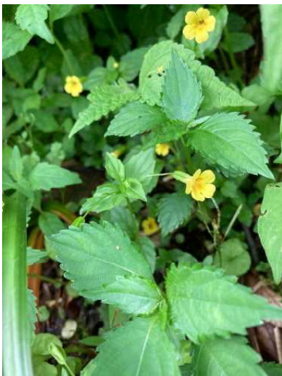
オオバミゾホオズキ