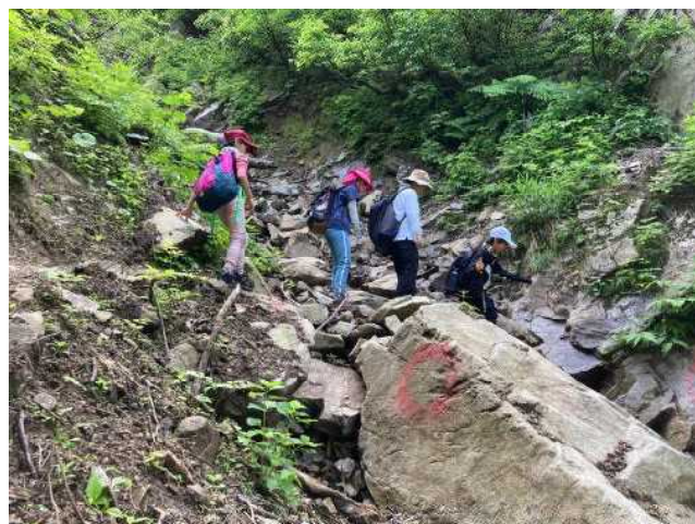
足下の悪い沢を通過

これから、岩場や大小の沢などのいくつもの難所を、お互い励まし合って越えていき、大鳥池を目指します。