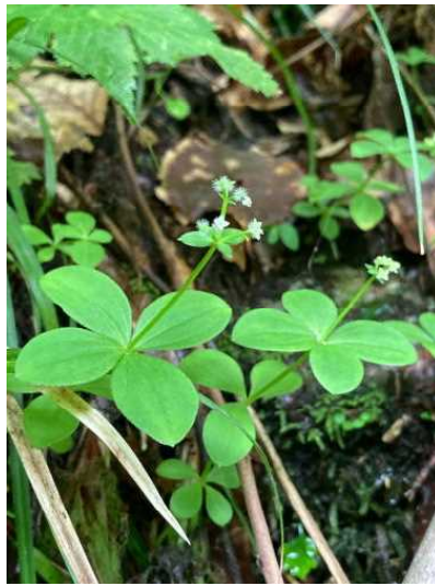
エゾノヨツバムグラ