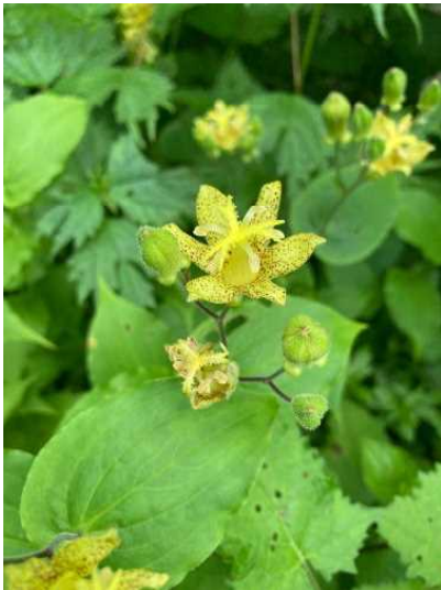
タマガワホトトギス