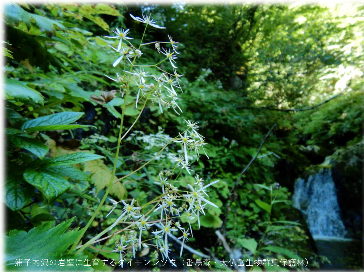
浦子内沢の岩壁に生育するダイヤモンドソウ（番鳥森・大仏岳生物群集保護林）