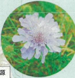
タカネマツムシソウ