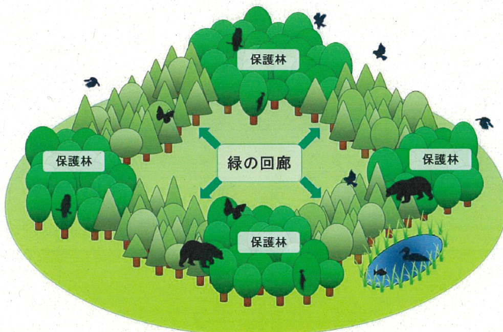
【緑の回廊のイメージ図】

また、緑の回廊においては、野生生物の移動実態や森林施業との因果関係等を把握するため、モニタリングに努め、その結果を緑の回廊の設定及び取扱いに適切に反映させることとしています。