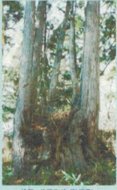
杉類・佐渡スギ (秋田県)