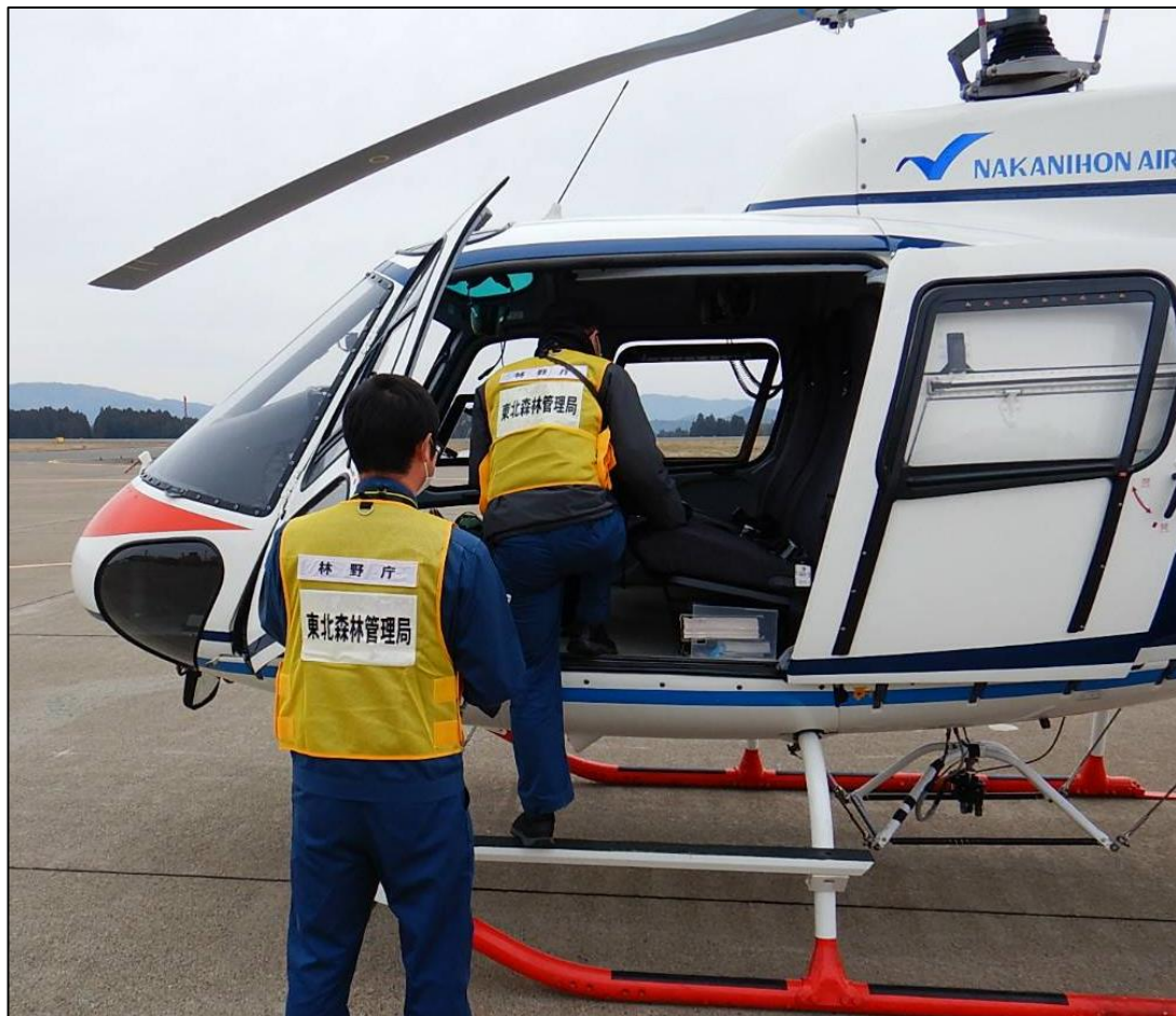
ヘリコプターに乗り込む調査職員