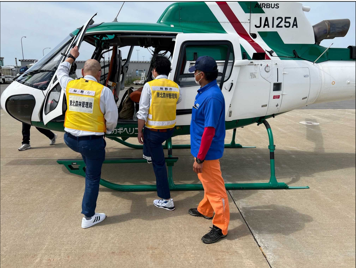
ヘリコプターに乗り込む調査職員