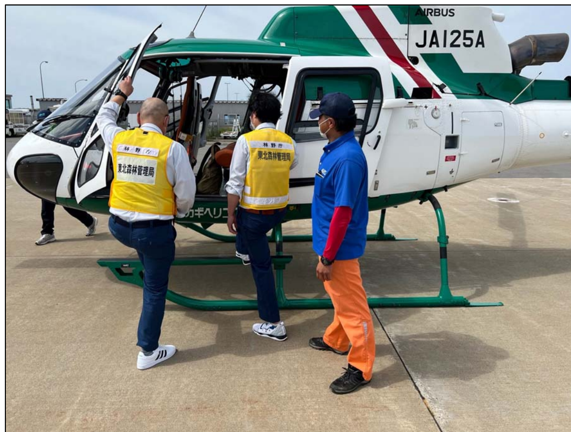
ヘリコプターに乗り込む調査職員