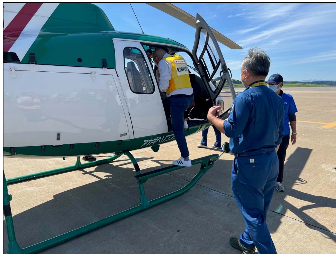
ヘリコプターに乗り込む調査職員