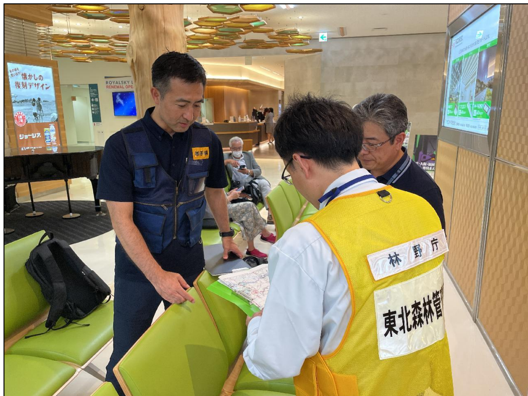
ヘリコプターに乗り込む調査職員