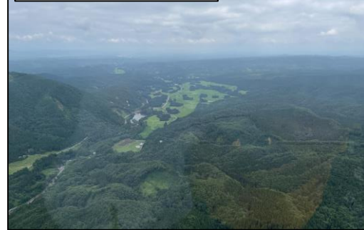
⑥国有林1060林班（湯沢市）