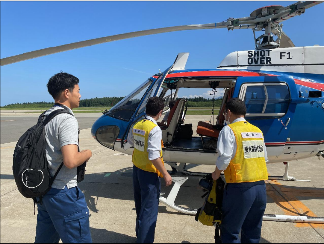
ヘリコプターに乗り込む調査職員