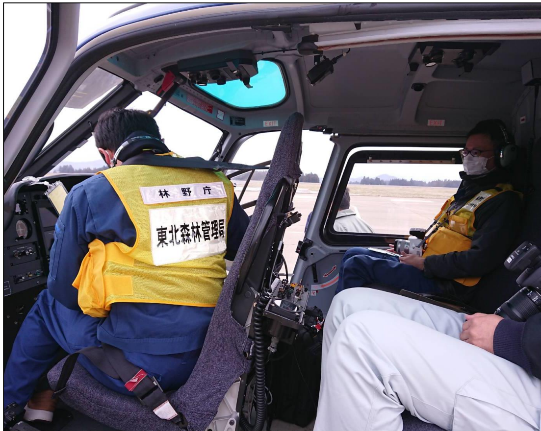
ヘリコプターに乗り込む調査職員