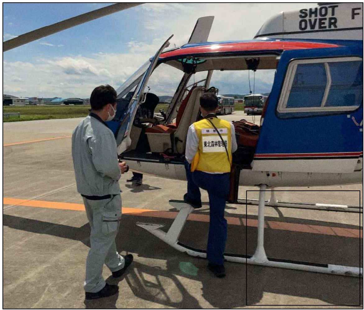
ヘリコプターに乗り込む調査職員