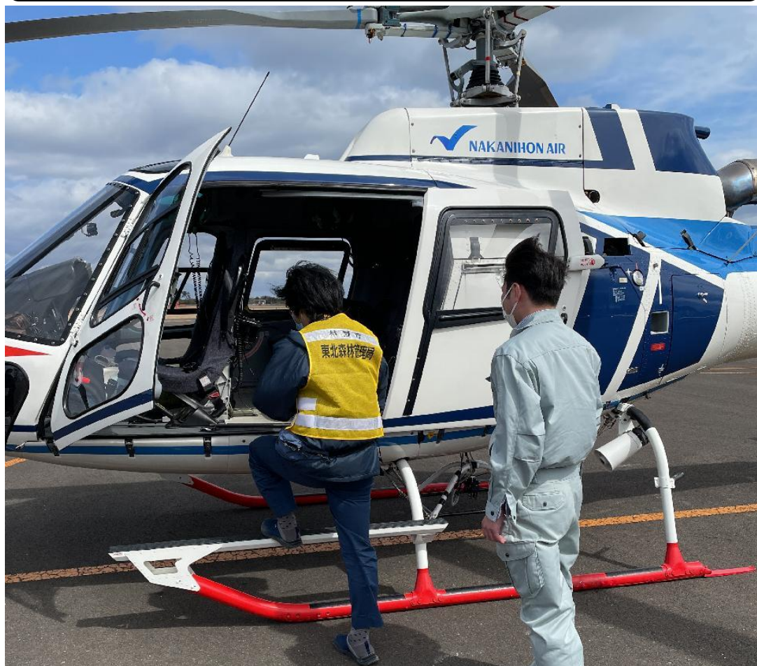
ヘリコプターに乗り込む調査職員