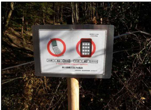
携帯電話等通信可能地点調査