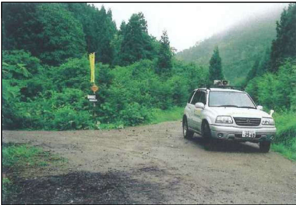
宣伝カーによる交通事故防止の呼びかけ