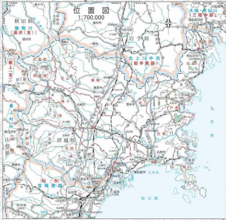
平成30年度策定計画国有林野施業実施計画図林齢早見表 西暦2018年度(平成30年3月31日現在)