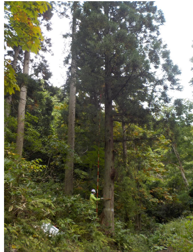
写真の職員が測定しているスギは、樹高22m、 胸高直径(地上から約1.2mの位置の直径)45c mでした