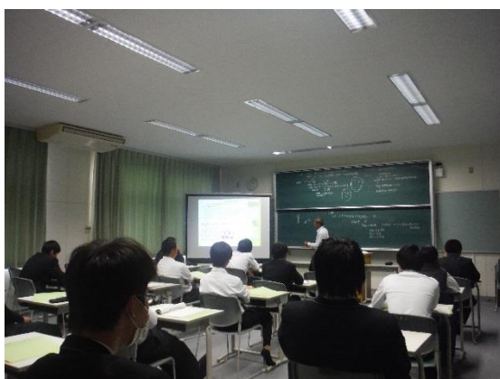
熱心に耳を傾ける3年生