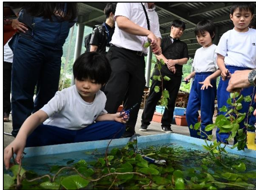
シラクチカズラ苗木づくり