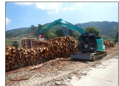
現場で集積された木材