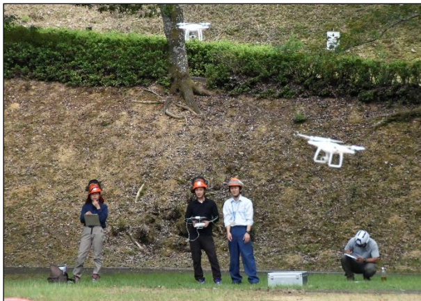
ドローン操作実習(とくしま林業アカデミー)