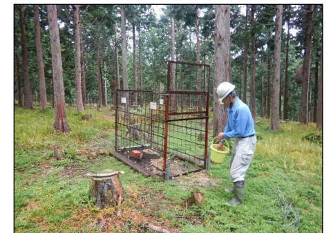
小型囲いワナによる請負でのシカ捕獲