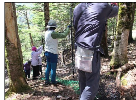
ボランティア団体による防鹿ネット設置

※ 南つるぎ地域活性化協議会は、剣山南西地域の環境保全と地域の活性化を目的に山に関わる団体等をメンバーとするボランティア団体