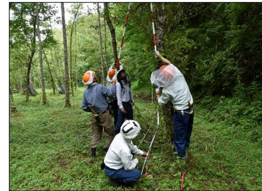
シラクチカズラの植生調査