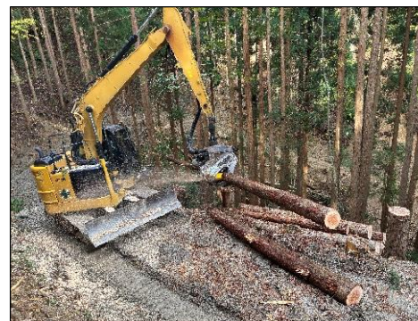
木材生産現場(三好市東祖谷)