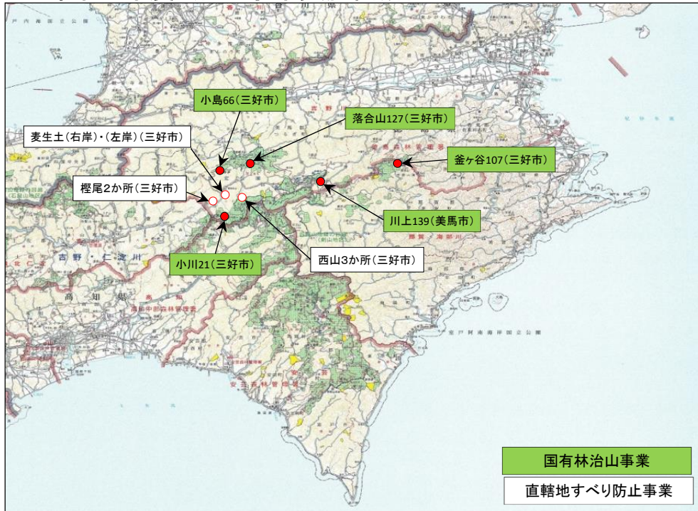
直轄地すべり防止事業