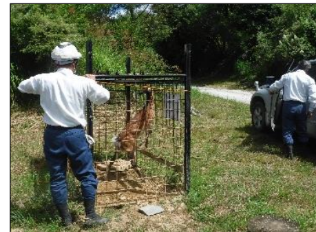
職員によるシカ処理状況