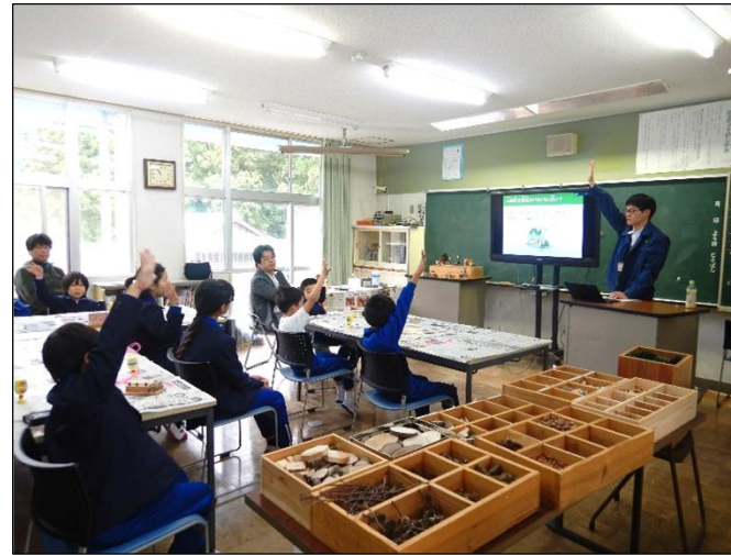
小学校での森林教室