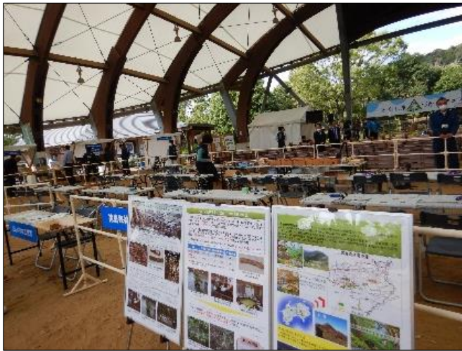
とくしま木づかいフェア