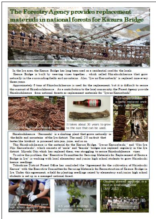
かずら橋の英語版パンフレット

https://www.rinya.maff.go.jp/j/kokuyu_rinya/kokumin_mori/katuyo/reku/rekumori/tsurugisan.html