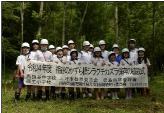
シラクチカズラ保存の植栽式