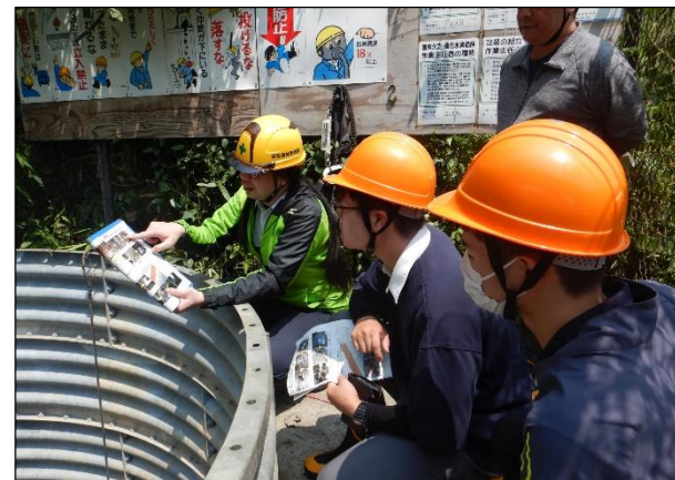
大学生へのインターンシップ