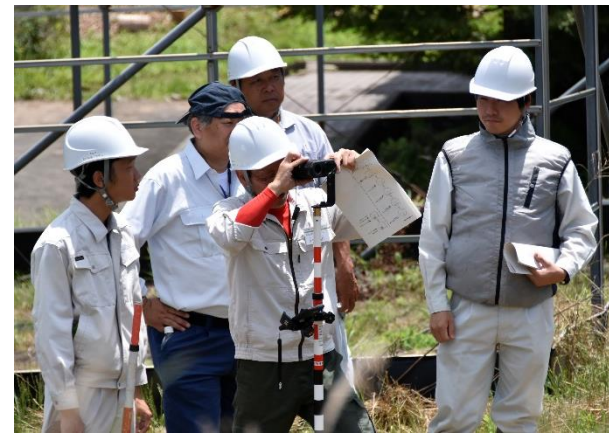
GNSS測量実習(三好林業アカデミー)