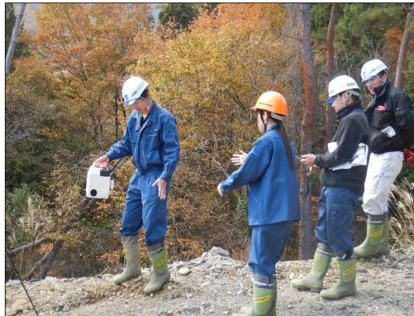
ICT機器測量現地検討会