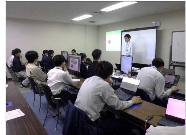
DSM・空中写真を活用した図面作成講習