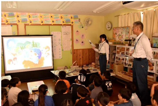
保育園での森林教室