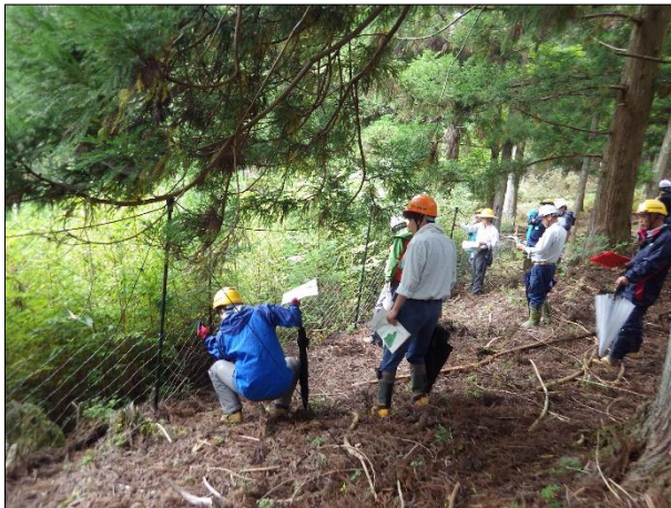
複層林における獣害対策の現地検討会