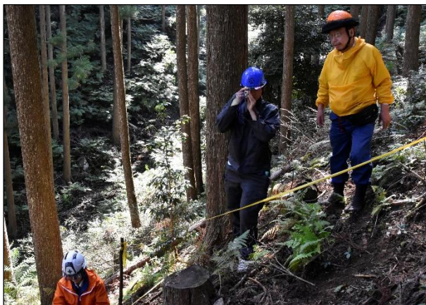
森林調査実習(那賀高校)