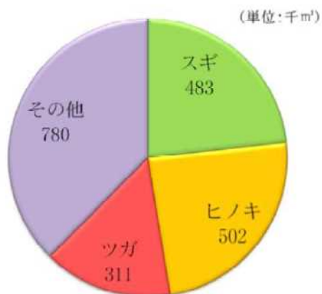
主要な樹種の賦存状況