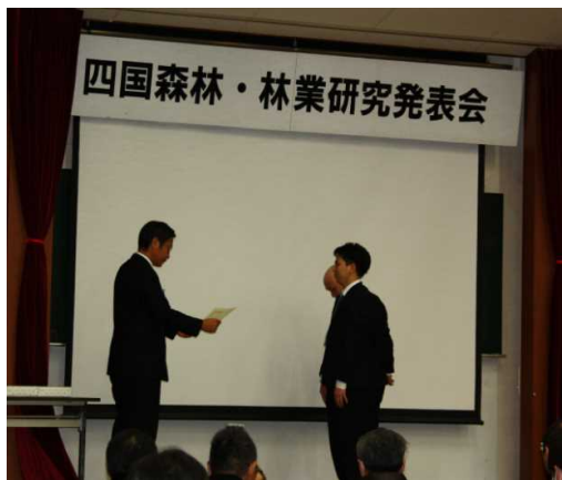
表彰式の様子（昨年）