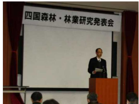
委員による講評の様子（昨年）