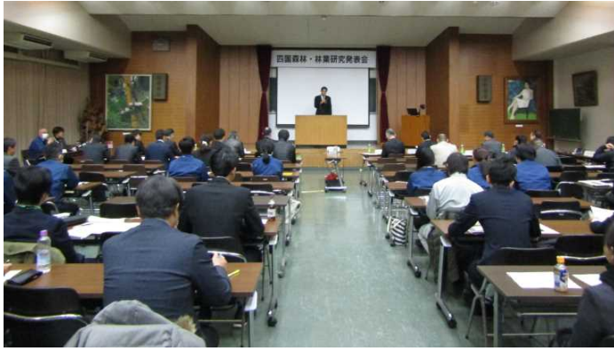
発表会 会場の様子（昨年）