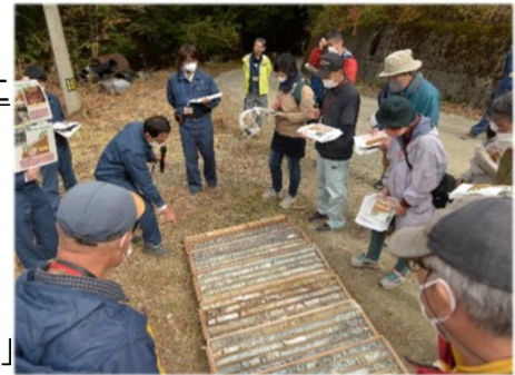
【治山事業の説明(R4 徳島県三好市)】