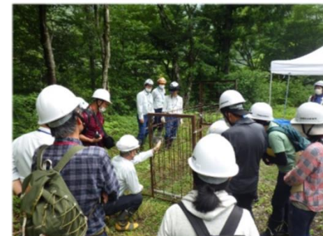
【困いわなの見学(R5 高知県いの町)】