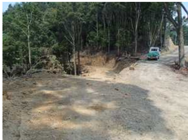
民有林・国有林の森林作業道の接続部分 (左：民有林、右：国有林)