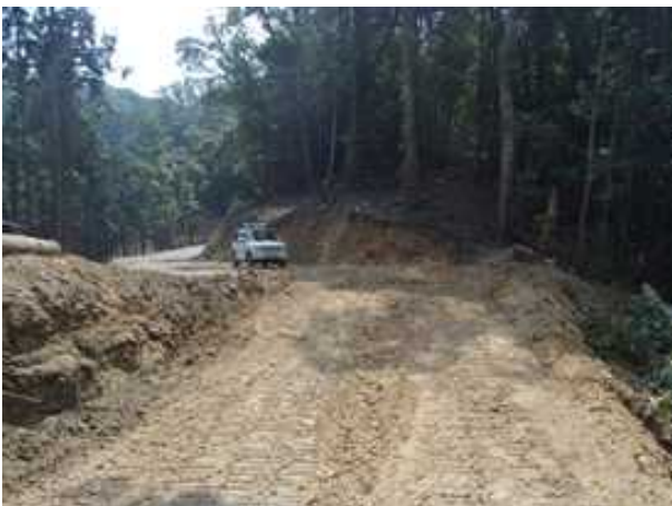
整備された国有林内の森林作業道