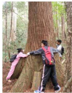
真優美杉での体験

私は、屋久島研修で屋久島の杉を見たことがあったので、「魚梁瀬杉は大きい」と先生から聞いても、それほど期待はしていませんでした。しかし、実際に魚梁瀬杉を見ると、思っていたよりも大きく立派な杉だったのでびっくりしました。さらに、実際の木の幹と同じ大きさに作ったロープの輪でその大きさを体験させてもらいました。一二人が入ってもまだ余裕があり、見た目よりも大きいことに驚きました。