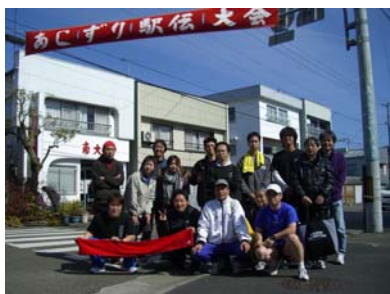
足摺駅伝を終えて