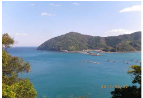
上ノ加江港と灘山国有林(山頂が雲囲城跡)

管内の国有林には、中土佐町上ノ加江の海岸に面して灘山国有林等が点在しており、シイノキやカシノキを主とした広葉樹林の魚付保安林(約一〇鈔)があります。そして、この灘山は、山頂にはその昔、海の監視と安全を守るため「雲囲城」と名付けた城があったそうです。また、平成一五年から地元の上ノ加江中学校と「ふるさと灘山」遊々の森(約五〇鈔)の協定もされ、学習の場としても活用されています。