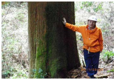
「ばんば杉」と筆者：江入首席森林官

その他、林内には明治から昭和初期の時代のものと思われる炭焼き窯の跡が数多く残っており、高知県中西部の当時の生活の中で炭焼きが盛んであったことを伺い知ることが出来ます。当森林事務所の森林は、人工林率約八四％で殆どが保安林に指定されており、林齢二六年生から四五年生が中心的な森林となっています。