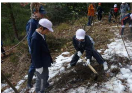
雪をかき分けながらの植樹体験

四年生の森林教室は今回で終了しますが、今後も植樹した木の生長や身近な自然に関心を持ち続けてもらいたいと思います。