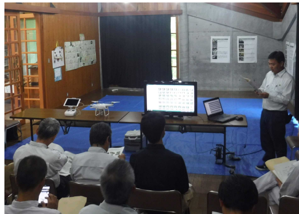
ドローン活用の取組の説明の様子