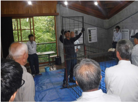
小型囲いワナ「こじゃんと1号」の組立方法の説明の様子