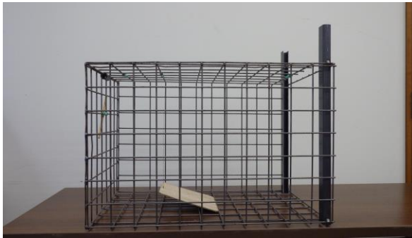
写真4 ノウサギ捕獲用箱わな改良