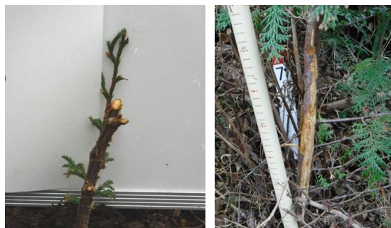
写真 1 植栽後 1 ヶ月

このことから、本課題は、植栽計画の段階から適切な対策を講ずるため、ノウサギによる被害状況を把握し効果的な食害防止対策に繋がる手法の開発・検証を実施することとした。