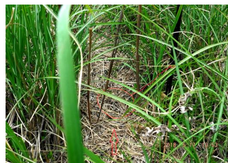
写真 2 ノウサギの通路にくくりわな