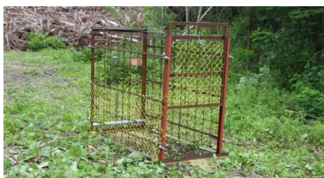
写真 8 こじゃんと1号を使ったわな