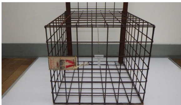
写真6 ネズミ捕り機