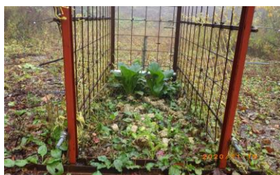
小松菜とハイキューブの餌