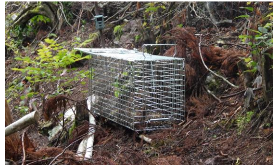
写真5 市販の箱わな