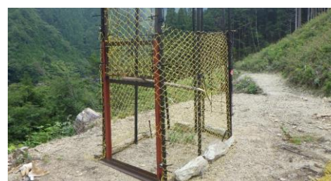
写真 9 ネットを使用した囲いわな