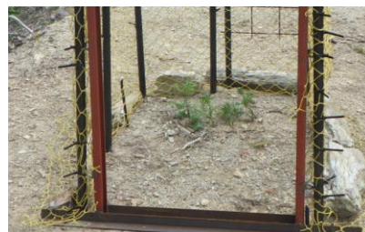
コウヨウザン苗の餌