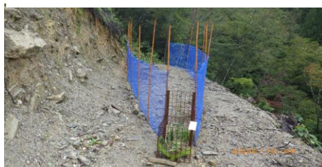
写真 10 ネットを使用した誘導わな