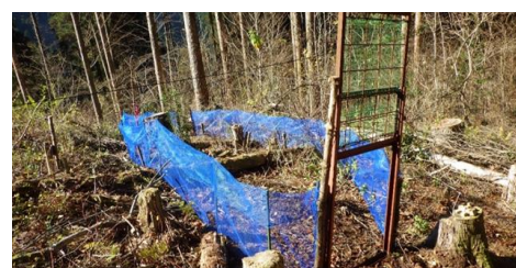
写真 11 ネットを使用した誘導わな