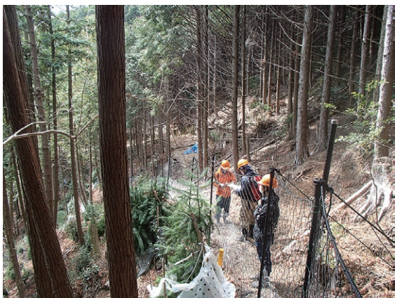
コウヨウザン試験地見学