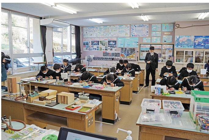
クラフト製作の様子

この学習を通して、木の持つ手触りや温もりなど、素材としての木材の良さや作る楽しさを理解してもらえたものと思います。