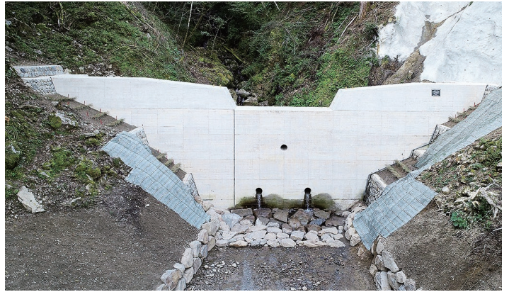
農林水産大臣賞 大段続山（2078）復旧治山工事（翌債）