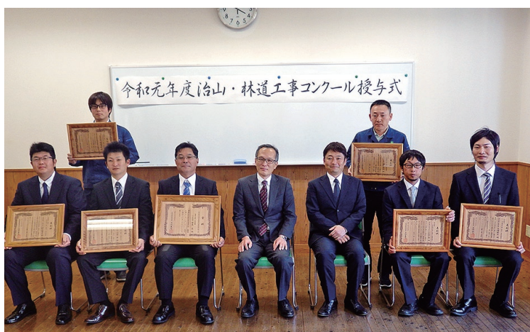
安芸森林管理署での表彰式