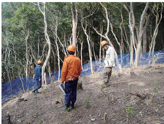
ウバメガシ更新試験地見学

営、森林管理署の業務や役割への理解を深めるため、インターンシップの受け入れに努める考えです。