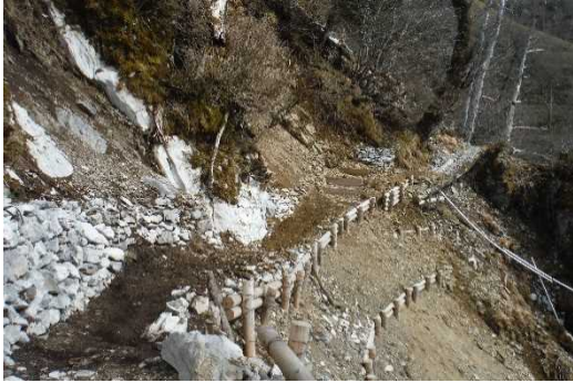
平成 29 年度に整備した歩道