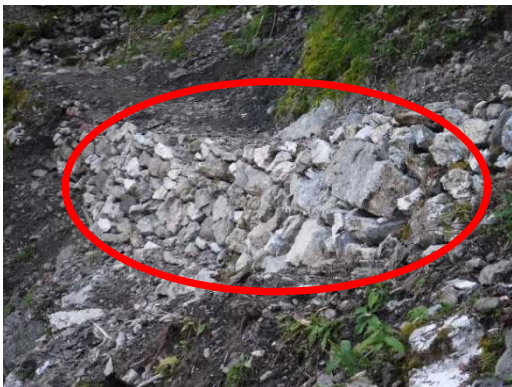
崩落箇所の整備(国有林内にある石を利用した 空石積み工)