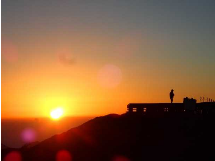
剣山頂上からの朝日