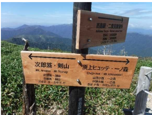
剣山頂に設置した多言語案内板(国有林内)