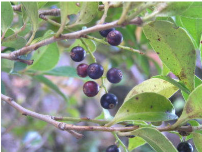
小さな果実を多数付ける。