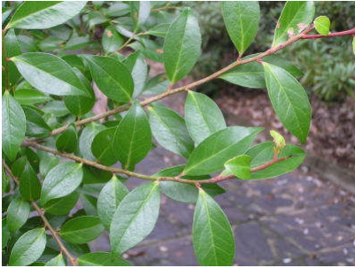
鋸歯は目立たない。