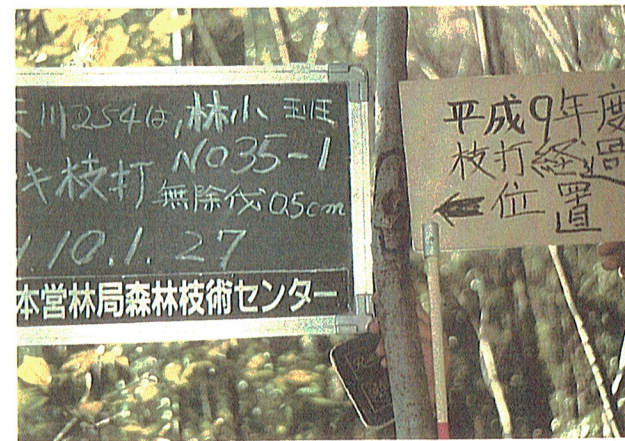
平成9年度254号は、枝打経過 平成10年1月27日撮影