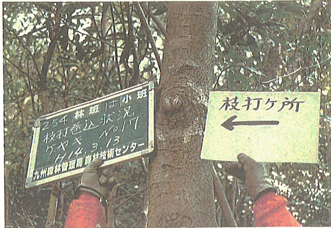
ケヤキ No.17 平行 (2cm)