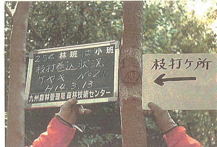
ケヤキ No.21 平行 (密着)