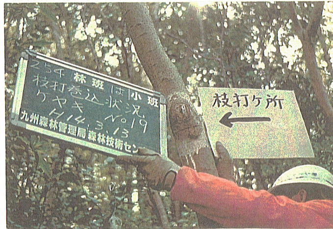
ケヤキ No.19 平行 (密着)