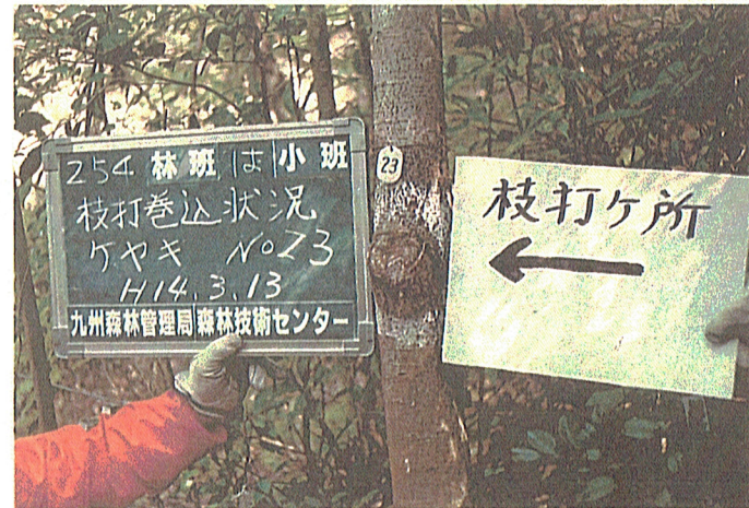
ケヤキ No.23 角度 (45°)