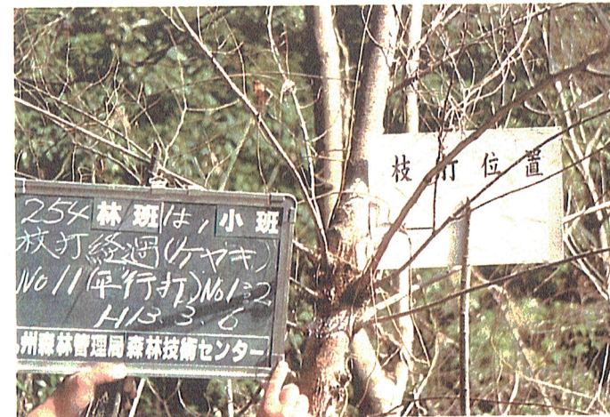
平成12年度254は, 枝打経過 平成13年3月6日撮影