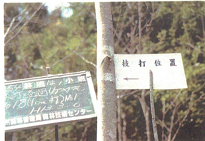
平成12年度254は, 枝打経過 平成13年3月6日撮影