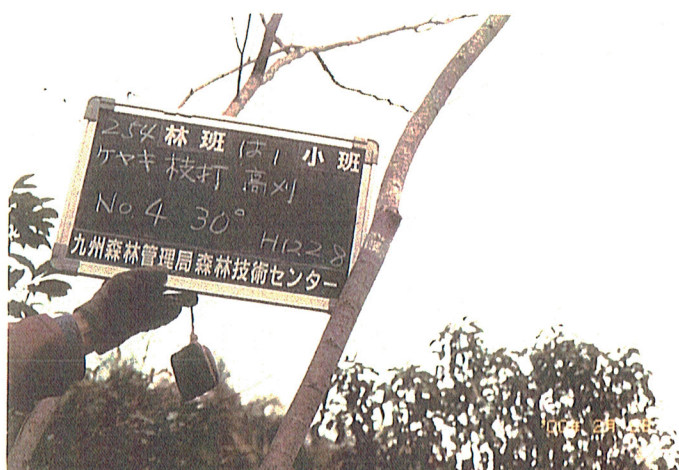
平成11年度254は1枝打経過 平成12年2月8日撮影