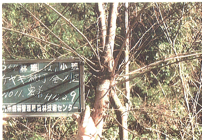
平成11年度254は1枝打経過