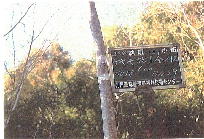
平成11年度254は、枝打経過 平成12年2月9日撮影