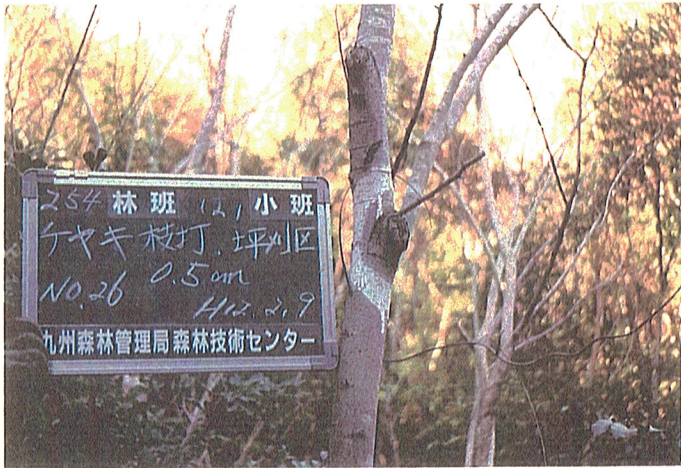
平成11年度254は1枝打経過 平成12年2月9日撮影