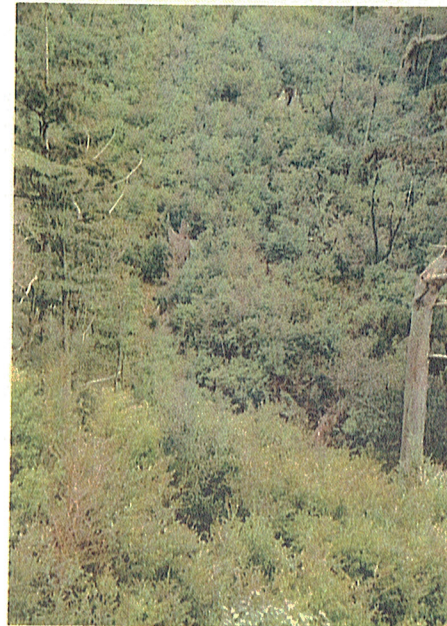
2. プロット 2号の近景写真