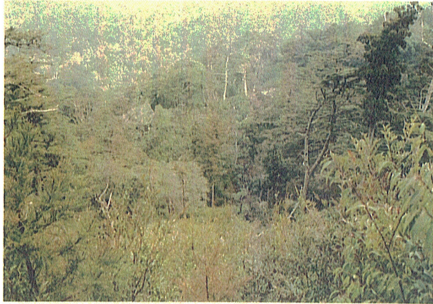
5. プロット 1号の遠景写真