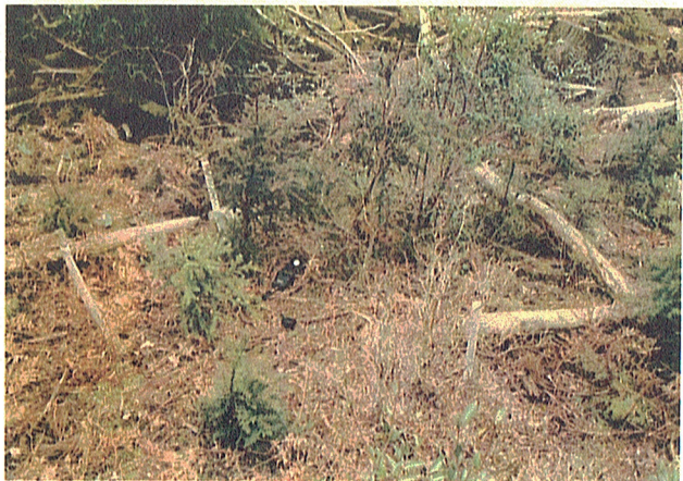
7. プロット 5号内の状況 及び照度調査の様子