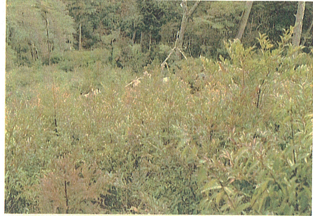
6. プロット 2号の近景写真