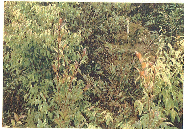
8. プロット 6号内の状況 及び照度調査の様子