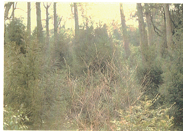
4. プロット5号付近の 成長のふいけ