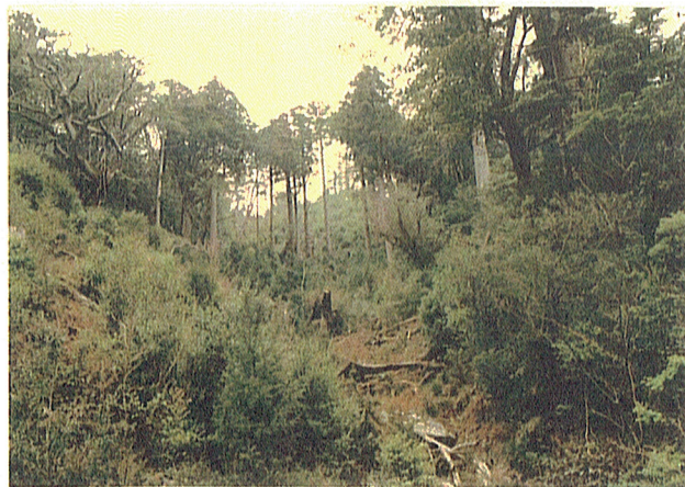
3. プロット 5号近景写真