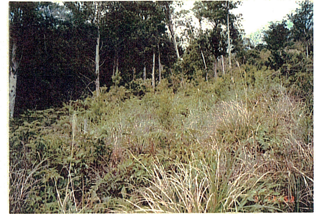
イヌマキ天然更新箇所の近景