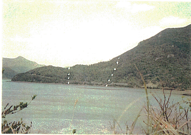
イヌマキ天然更新箇所の遠景