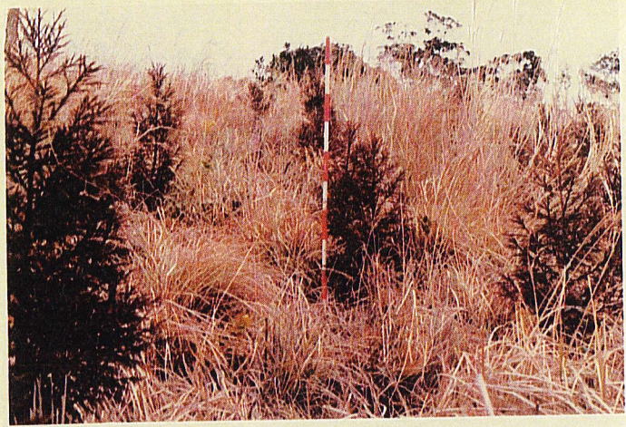
苗長 60 cm 根長 20 cm