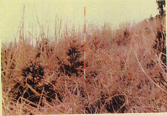
苗長 40 cm 根長 15 cm