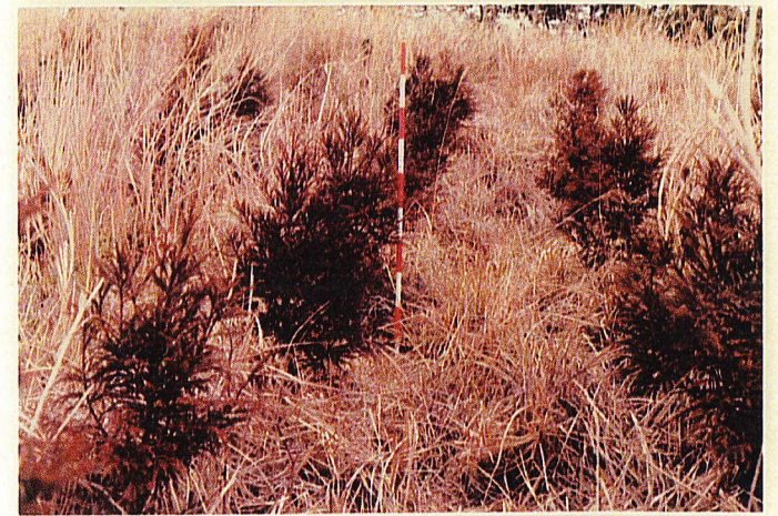
苗長 80^{cm} - 10^{cm}