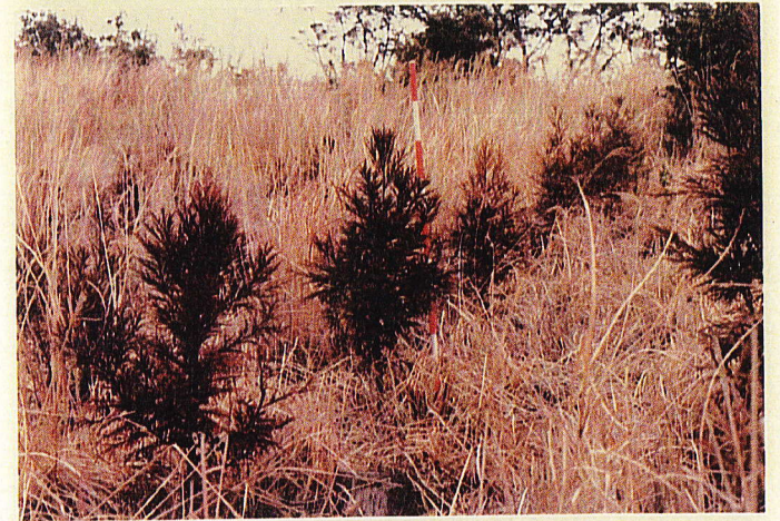
苗長 80^{cm} - 15^{cm}