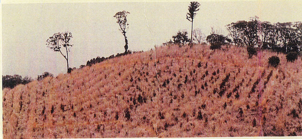
試験地全影、右より3列毎に 苗長 80^{cm} - 20^{cm}, 15^{cm}, 10^{cm} 60 - 20, 15, 10 40 - 20, 15, 10 対照区