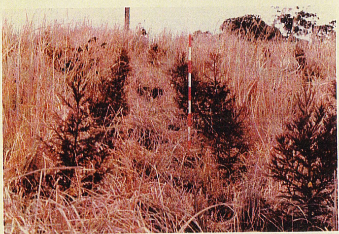
苗長 60 cm - 15 cm