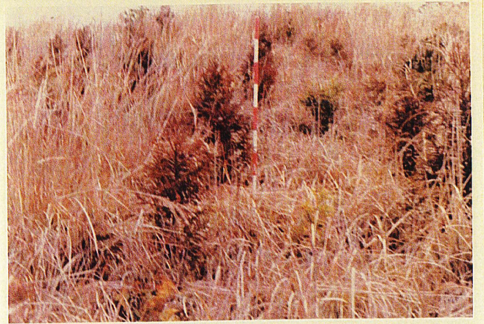
苗長 60 cm - 10 cm