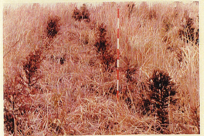
苗長 40 cm - 20 cm