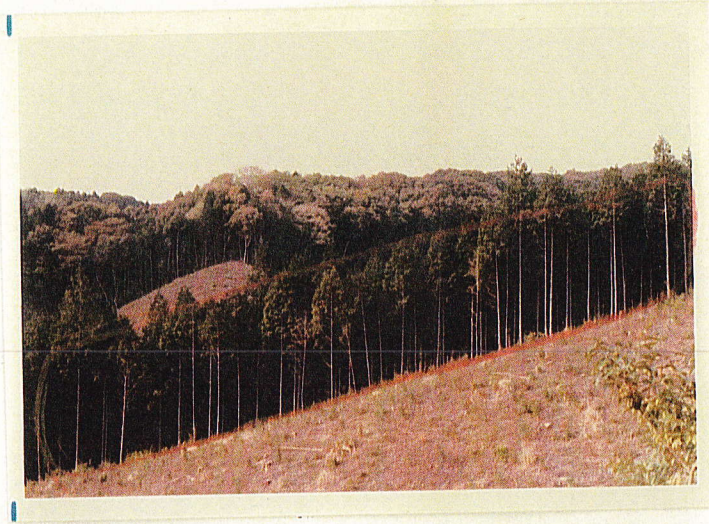
林外から試験地望む