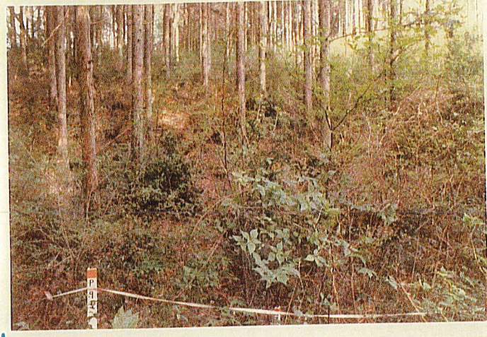
試 験 プ ロ ッ ト 9 号