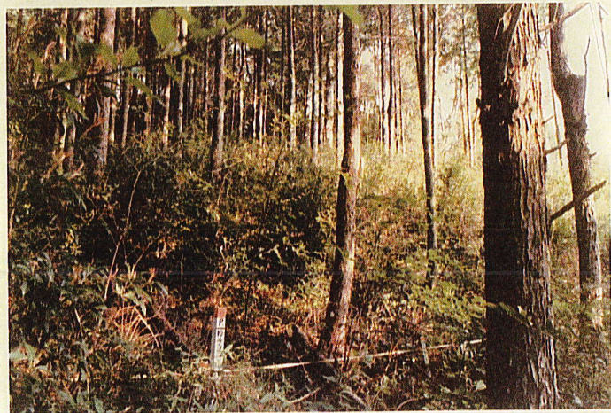
試 験 プ ロ ッ ト 10 号