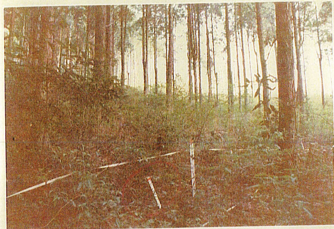
生 育 不 良 の 植 栽 木