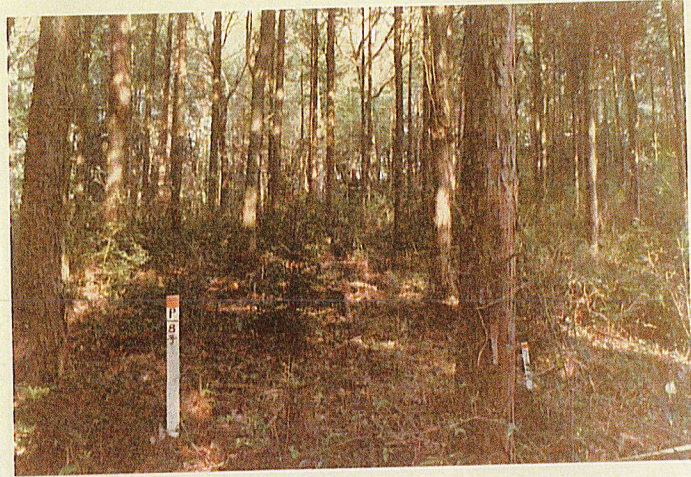
試 験 プ ロ ッ ト 8 号