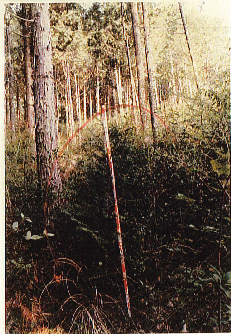
生 育 良 好 な 植 栽 木