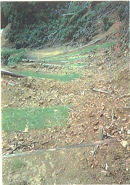
'8年 7. 11