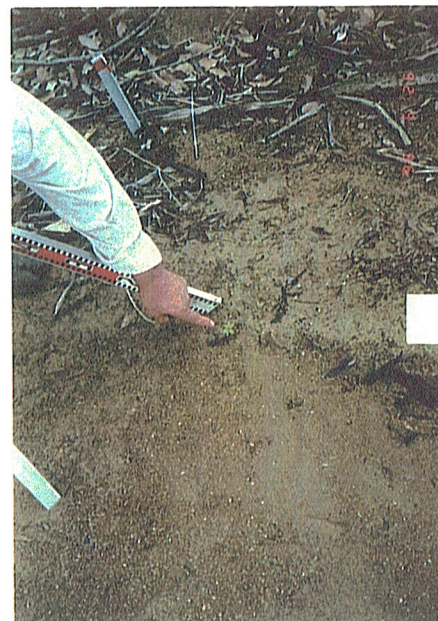
発芽確認 1号区 平成8年6月26日