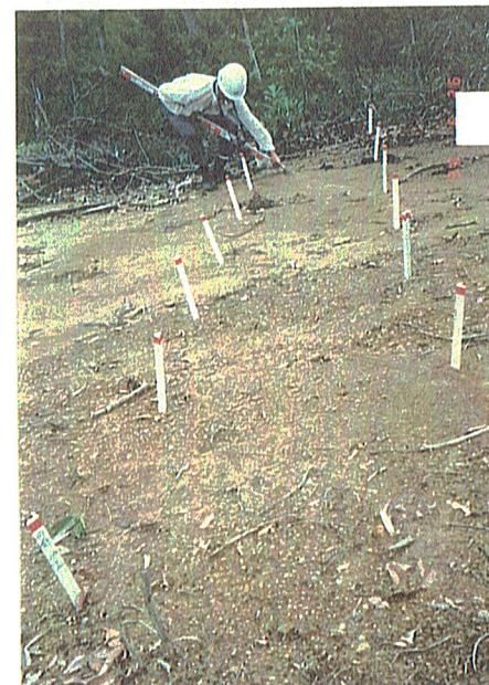
発芽確認 1号区 平成8年6月26日