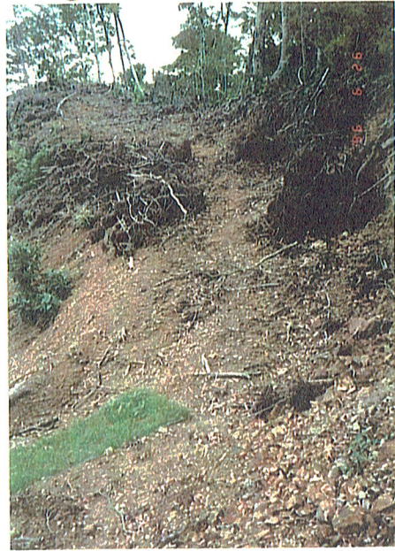
'8年 7. 11