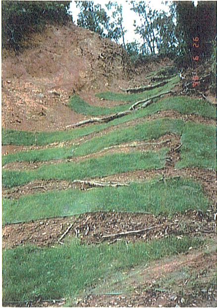
'8年 7 11