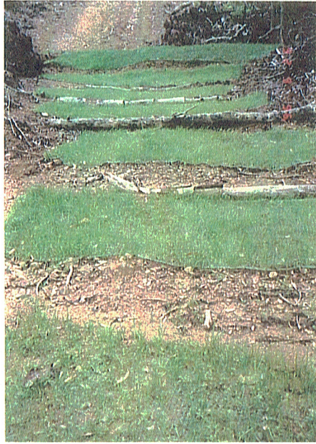
'8年 7 11