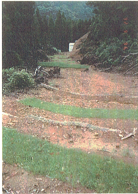
'8年 7. 11