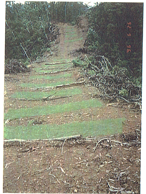
'8年 7. 11