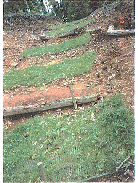
'8年 7 11