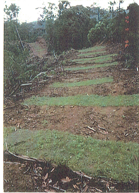
'8年 7. 11