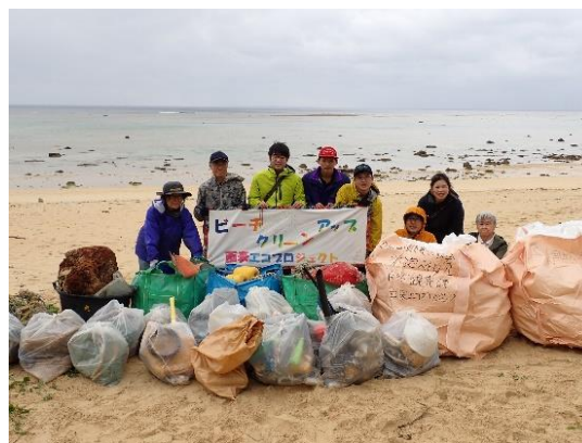
南風見田海岸のビーチクリーン活動

西表島の海岸林や優れた景観を守り自然環境を保全するため、竹富町・地域住民・ボランティア団体等と連携し、海岸林等の清掃やビーチクリーン活動に取り組みます。