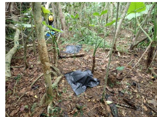
ギンネム伐採後のマルチシートによる萌芽抑制