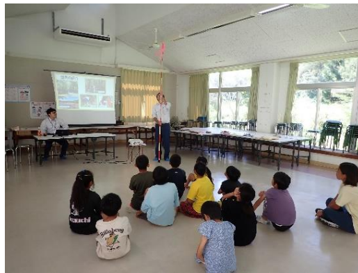
小学校での森林教室