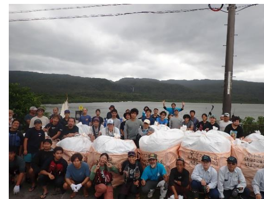
船浦湾のビーチクリーン活動