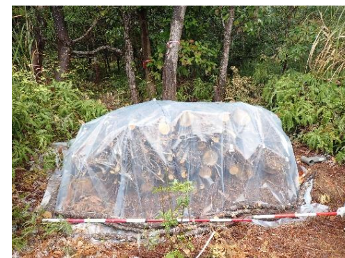
被害木の被覆シート処理