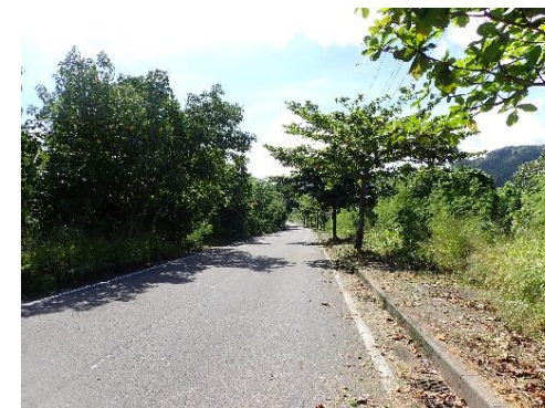
イリオモテヤマネコのロードキル対策(県道刈払い後)