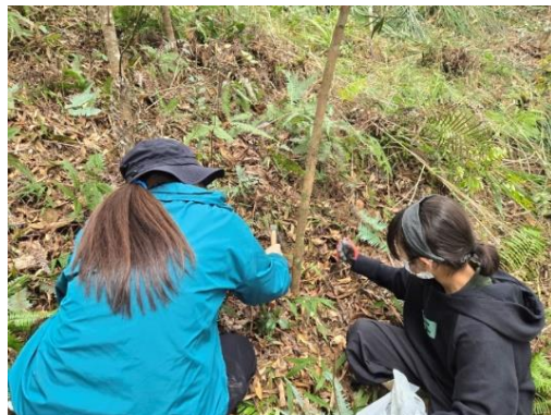
「古事の森」での小学生による 施肥作業