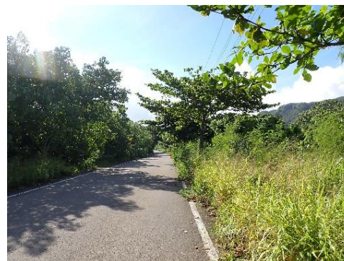
イリオモテヤマネコのロードキル対策(県道刈払い前)

イリオモテヤマネコを保全するため、行政機関・地域住民・ボランティア団体等と連携し、県道の環境整備(草刈り)活動等に取り組みます。