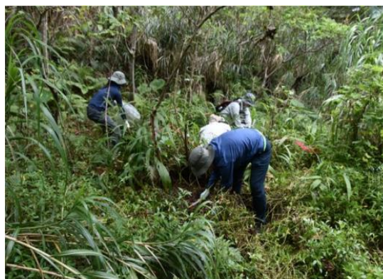
沖縄北部でのアメリカハマグルマの駆除