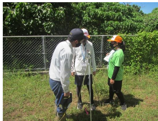
職場体験学習への協力

地元の小・中学生を対象に、職場体験学習への協力や森林環境教育へのフィールド提供等により、人材育成や森林環境教育に取り組めます。