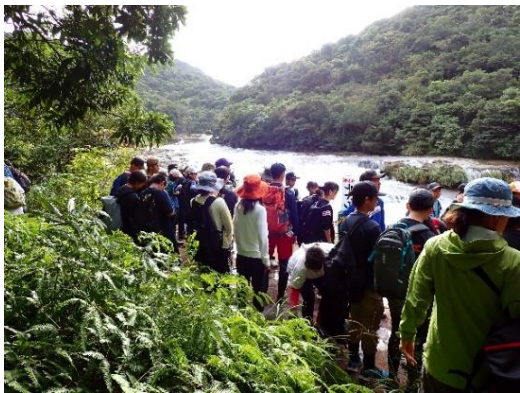
三重大行事支援(テドウ山登山)

関係機関と連携して、希少野生動植物の密猟・盗掘等防止のための普及啓発活動を行います。また、国際協力機構(JICA)が行う生物多様性国際目標に向けた沿岸・海洋生態系保全管理のための研修等への協力に取り組みます。