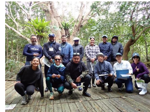
国際協力機構(JICA)による課題別研修