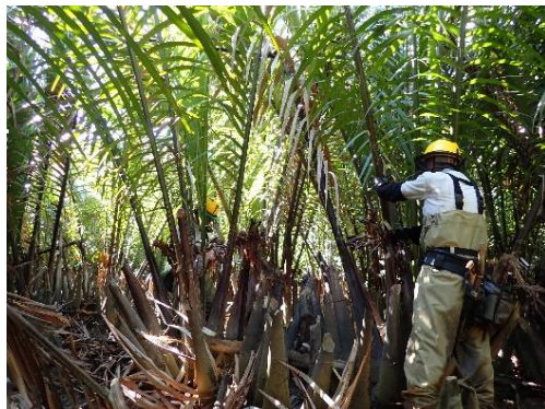
船浦ニッパヤシ希少個体群 保護林

希少種等の保護・増殖等のため、生育状況及び生育環境の経年変化等の把握、自動撮影カメラによるノヤギの生息状況の把握に取り組みます。