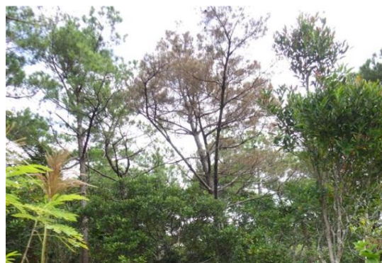
松くい虫被害状況

沖縄県においては、松くい虫被害対策として総合的かつ広域的な被害対策を実施しています。国有林においても松くい虫被害が発生していることから、被害の蔓延防止のための対策について沖縄県等の関係機関と連携し、伐倒駆除による被害対策に取り組めます。