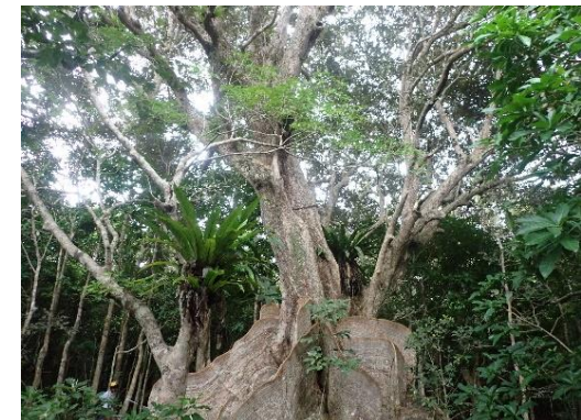
森の巨人たち百選に選定されている仲間川のサキシマスオウノキ