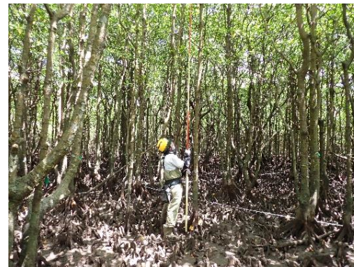
マングローブ林の生長量調査

マングローブ林並びに西表島の巨樹・巨木選定木の保全・保護のため生育状況及び生育環境の経年変化等のモニタリング調査に取り組みます。