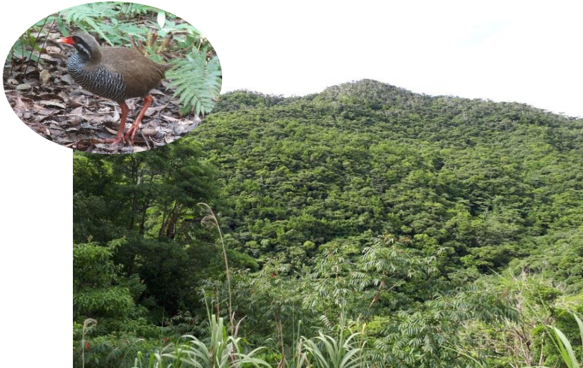
やんばるの森林生態系保護地域 [ヤンバルクイナ]