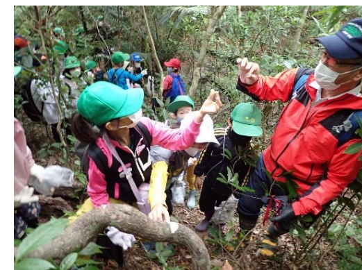
森林環境教育へのフィールド の提供