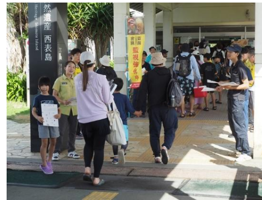
希少野生動植物の密猟・盗掘等防止のための普及啓発活動