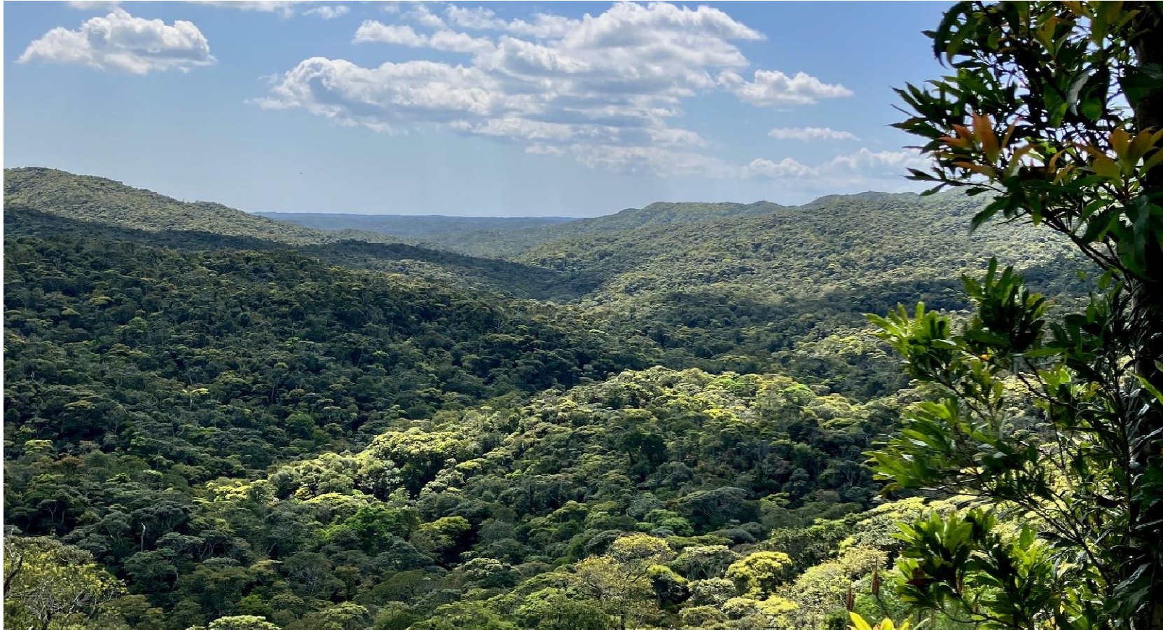
やんばる森林生態系保護地域 遠望