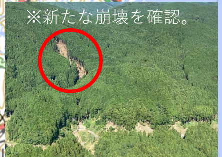
福岡県東峰村（民有林）