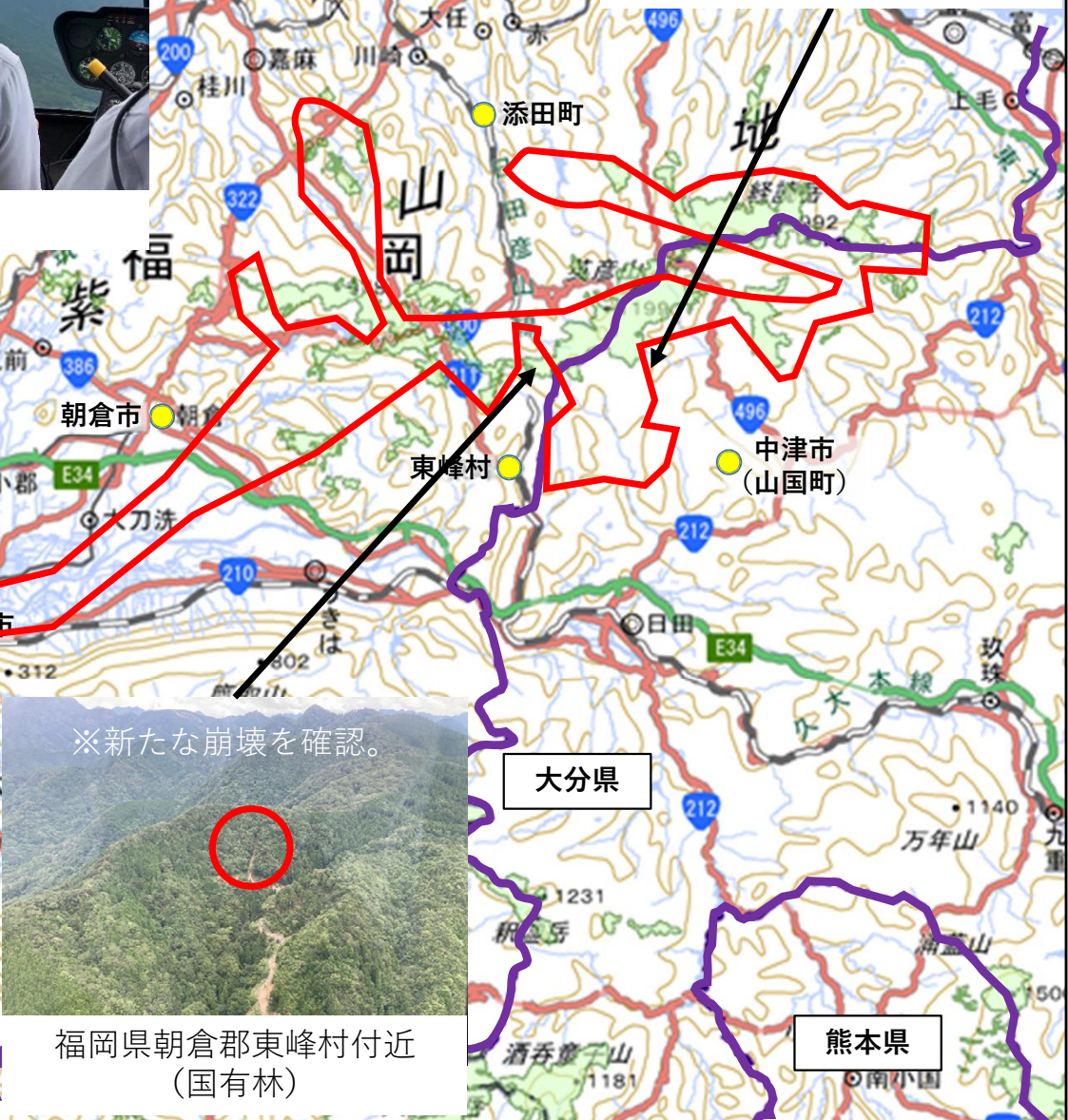
大分県中津市山国町付近 (民有林)