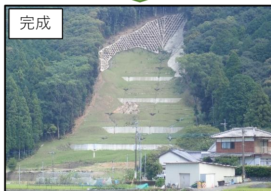
②芦北町大字花岡字岩本 (岩本地区)