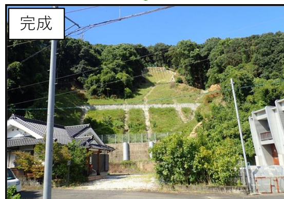
①芦北町大字湯浦字湯治 (湯治地区)