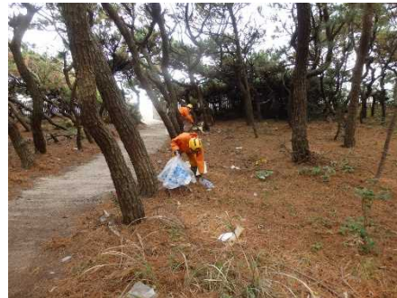
虹の松原 クリーン活動