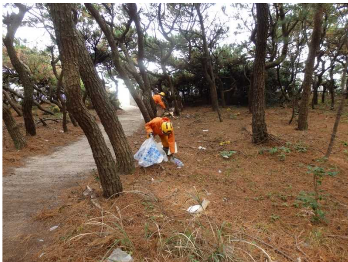
クリーン活動実施状況