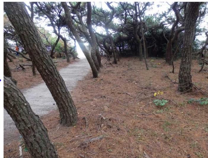
クリーン活動実施後の状況