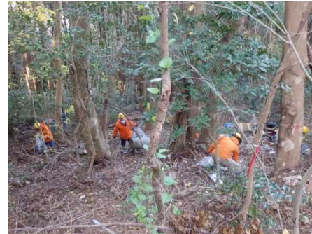
鐘撞谷国有林内 クリーン活動