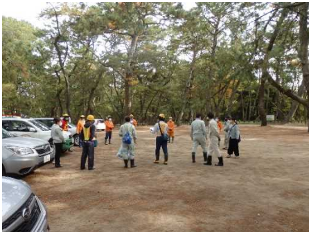
虹の松原 クリーン活動

今後、当署としましては、日常の巡視業務を継続するとともに、地元自治体等の協力も得ながら引き続き不法投棄防止に取り組むこととしています。