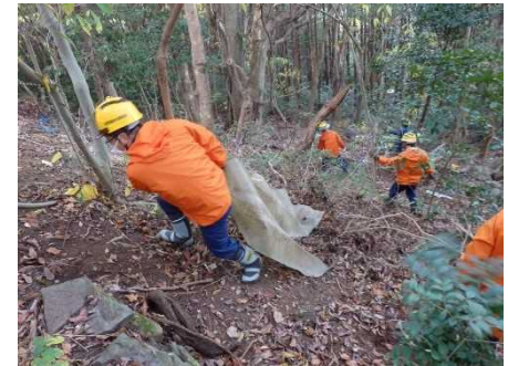
鐘撞谷国有林内 クリーン活動