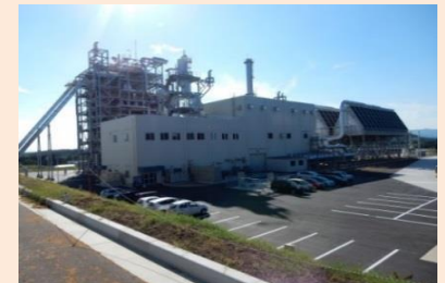
豊後大野木質バイオマス発電所

市町村森林整備計画の策定支援体制を整備し、地域課題解決に向け豊後大野市森林整備計画の策定を支援。