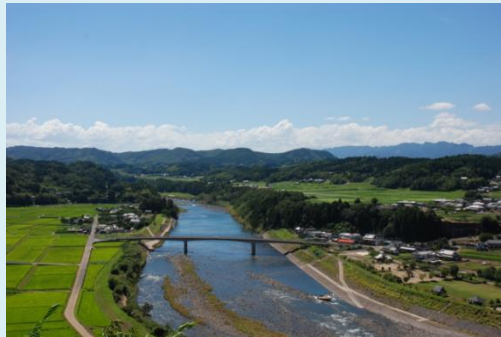
豊後大野市 江内戸の景

また、森林資源が充実するなか、主伐後の再造林放棄地の増加、増え続けるシカによる森林被害への対応、日本一といわれるシイタケ生産の維持継承など、地域が一体となった森林・林業の構想、構想の実現に向けた実践が望まれます。