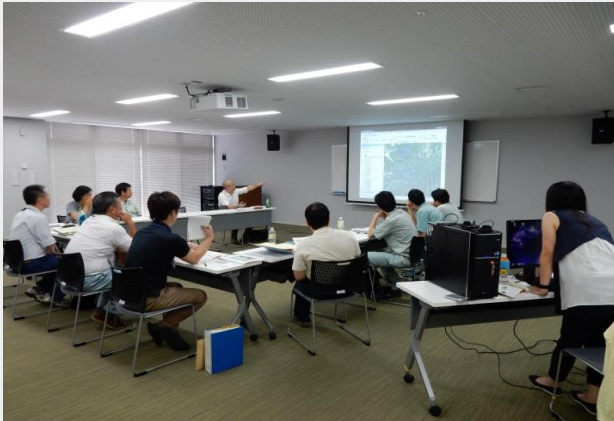
写真:ゾーニング検討会の様子