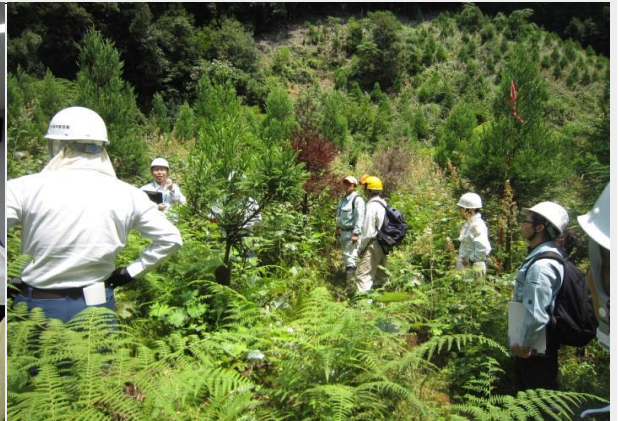
写真:大苗植栽による低コスト造林現地検討会の様子