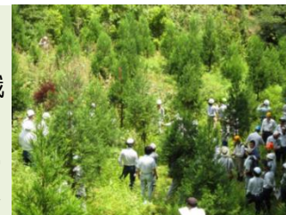
大苗植栽による低コスト造林 現地検討会

市担当職員等の森林・林業に関する知識や技術の向上を図るため、大苗植栽による低コスト造林現地検討会や森林作業道現地検討会を実施し、国有林の持つ技術の普及を図りました。