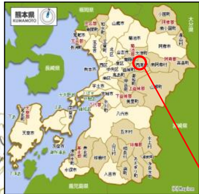
施設点検箇所位置図