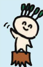
森林保険イメージキャラクター マモルくん

森林保険は、「森林保険法」(昭和12年法律第25号)等に基づき、森林所有者を被保険者として、森林についての火災、気象災、噴火災による損害を総合的に補償するもので、森林所有者が自ら災害に備える唯一のセーフティネットです。