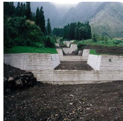
復旧工事（平成9年撮影）