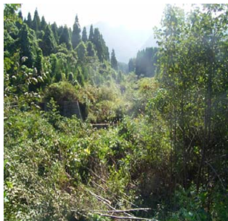
現況（平成20年10月撮影）